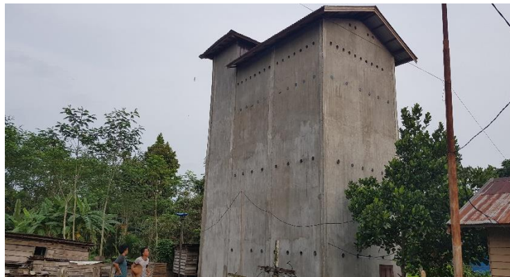
Gamabar 2.3 Bangaunan Sarang Burung Walet

Masyarakat Kabuapten Pulang Pisau terkait dengan pembudidayaan sarang burung walet ini, ada beberapa jenis tempat pembudidayaan sarang burung walet di wilayah Kabupaten Pulang Pisau, sebagai contohnya adalah bangunan burung walet juga memiliki jenis dan bentuk. Bangunan berupa gedung yang bertingkat dan sarang burung walet yang terletak di atas rumah pembudidayaan sarang burung walet.