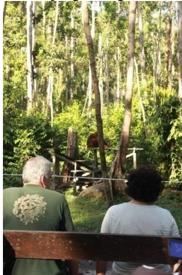
Gambar 4. Wisatawan Mancanegara di Taman Nasional Tanjung Puting (2014)

Taman Nasional Tanjung Puting dengan luasan 415.040 Ha, secara geografis terletak diantara 2°33'-3°32' Lintang Selatan dan 111°42'-112°15 Bujur Timur, meliputi wilayah Kecamatan Kumai, kabupatai Kotawaringin Barat dan Kecamatan Hanau serta Kecamatan seruyan Hilir Kabupaten Seruyan Kalimantan Tengah. Lebih Lanjut, sebagai taman Nasional yang dilindungi menurut Undang – Undang No. 5 Tahun 1990 tentang Konservasi Sumber Daya Alam Hayati dan Ekosistemnya, Taman nasional adalah kawasan pelesatarian alam yang mempunyai