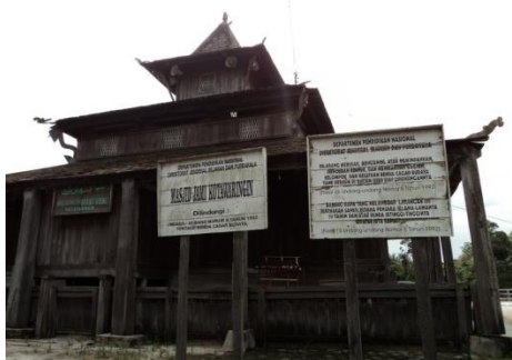
Gambar 12. Masjid kyai Gede

Masjid ini dahulu namanya Masjid Jami' Kutaringin kemudian di ganti menjadi masjid kyai Gede. Kyai Gede merupakan salah satu tokoh pada masa kerajaan Kutaringin I. Mesjid ini didirikan pada abad XVII, menandai awal berdirinya kerajaan Kutaringin. Meskipun usia masjid ini sudah ratusan tahun, mesjid ini memiliki