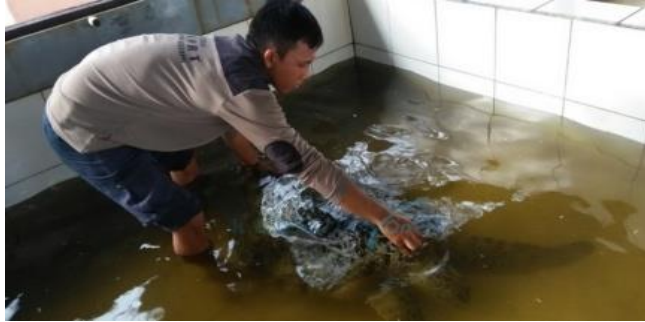
Gambar 6. Penyu di penangkaran