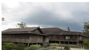
Gambar 11. Astana Mangkubumi

Bangunan rumah tradisional di Kalimantan pada umumnya adalah berbentuk rumah panjang (Lamin), namun bangunan rumah Adipati Mangkubumi ini adalah bangunan dengan bentuk pengembangan dari bangunan tradisional limasan yang pada umumnya adalah bentuk rumah tradisional di Jawa. Unsur pengembangan tersebut dapat dilihat pada bangunan induk di mana di bagian belakang dan depan ruang utama dibuat ruang, dan ruangan ini dibatasi dinding dengan ruang utama, dan sebagai penutup atap ruang ini adalah dengan meneruskan atap bangunan utama.