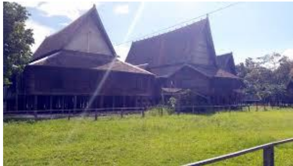
Gambar 10. Astana Al Nursari

Pada masa keemasan Kesultanan Kotawaringin, muncul kebijakan dari Negara induk, yakni Kesultanan Banjar yang menyerahkan Kesultanan Kotawaringin kepada Belanda. Hal ini dilakukan sebagai kompensasi atas bantuan Belanda yang membantu Kesultanan Banjar dalam peperangan. Peralihan kekuasaan Kesultanan Kotawaringin ternyata berdampak besar baik dari sektor perekonomian (monopoli perdagangan) dan pemerintahan. Akibat dari peralihan kekuasaan tersebut, maka dipindahkan juga pusat pemerintahan kesultanan Kotawaringin dari Kotawaringin Lama ke Pangkalan Bun di Istana Kuning, pada masa pemerintahan Sultan ke IX Pangeran Ratu Imanuddin (1805-1841).