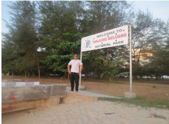
Gambar 5. welcome to tanjung Keluang National Park (2015)

Tempat ini merupakan tempat konservasi alam sehingga menjadi salah satu ecotourism di Kotawaringin Barat. Salah satu fauna yang di lestarikan di tempat ini adalah penyu, beberapa jenis penyu seperti penyu hijau dan penyu sisik ada di tanjung keluang ini. Perairan disekitar Tanjung keluang ini sangat istimewa karena menjadi titik dari jalur migrasi penyu bersisik yang bertualang di seluruh perairan yang terbentang di Nusantara bahkan dunia.