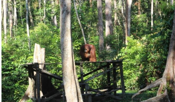
Gambar 3. Tempat Makan Orangutan (2014)

TNTP sebagai tempat habitat asli atau rumah bagi sekitar 6000 lebih individu orangutan Kalimantan. Sekitar 60% jumlah orangutan di dunia ada di Tanjung Puting. Orangutan atau dalam bahasa latinnya disebut Pongo pygmaeus ini merupakan salah satu alasan bagi wisatawan mancanegara berkunjung ke Kotawaringin Barat khususnya ke TNTP.