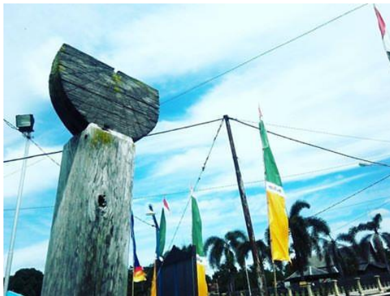
gambar 13. Jam Matahari

Mesjid ini juga memiliki petunjuk waktu (jam) yang berpatokan dengan cahaya matahari atau disebut jam matahari yang terbuat dari kayu ulin.