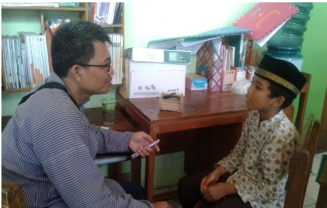
WAWANCARA PENELITI DENGAN SISWA