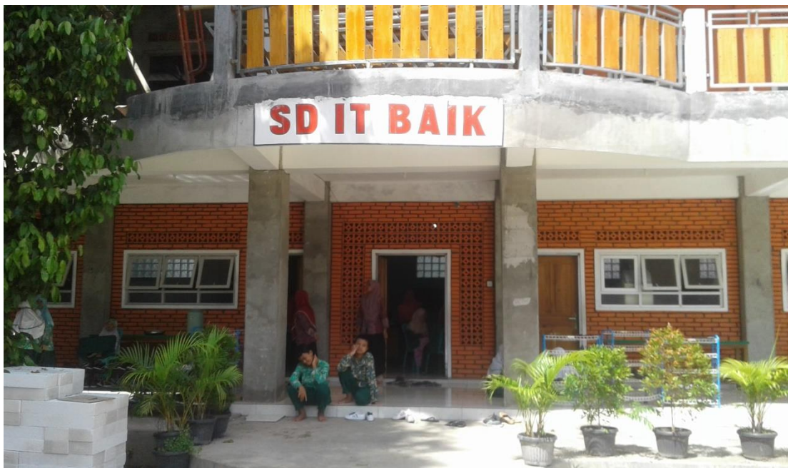
TANPA GAMBAR DEPAN SDIT BAIK