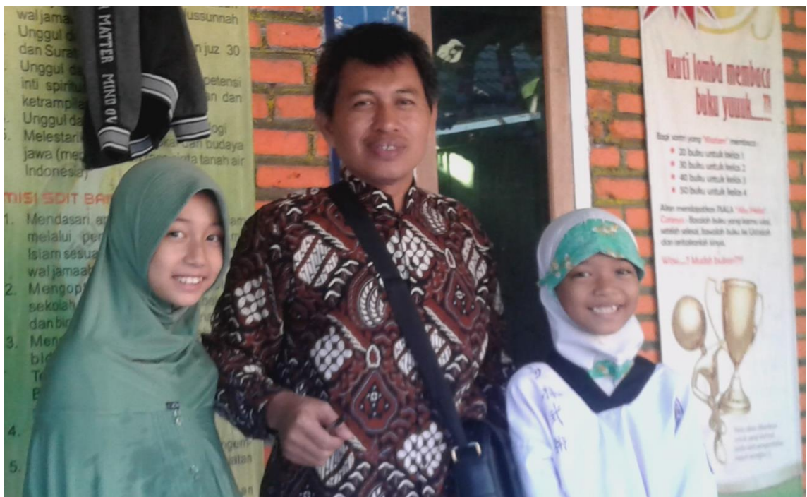
PENELITI OBSERVASI DAN WAWANCARA KEPADA SISWA