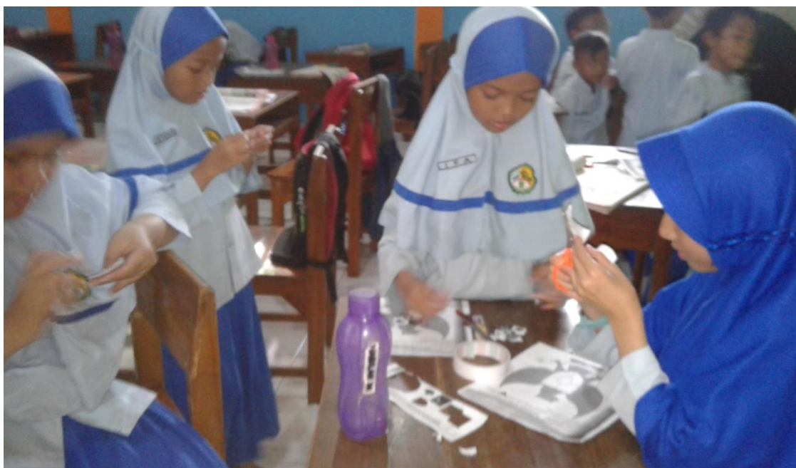
KEGIATAN BELAJAR MENGAJAR PADA PAGI HARI