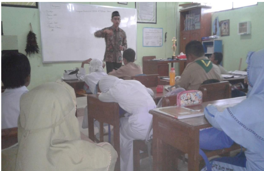
PROSES BELAJAR MENGAJAR PADA PAGI HARI