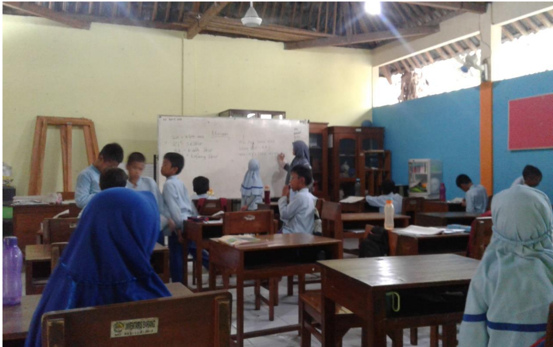
SUASANA KELAS GURU MENGAJAR TANPA KESIAPAN