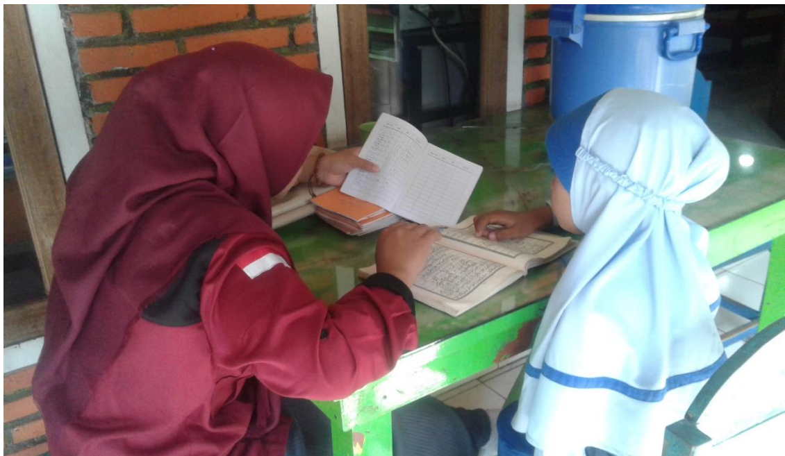
KEGIATAN BELAJAR IQRO'