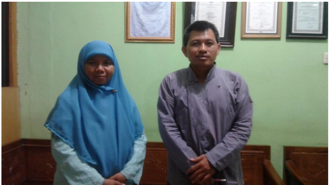
WAWANCARA PENELITI DENGAN KEPALA SEKOLAH