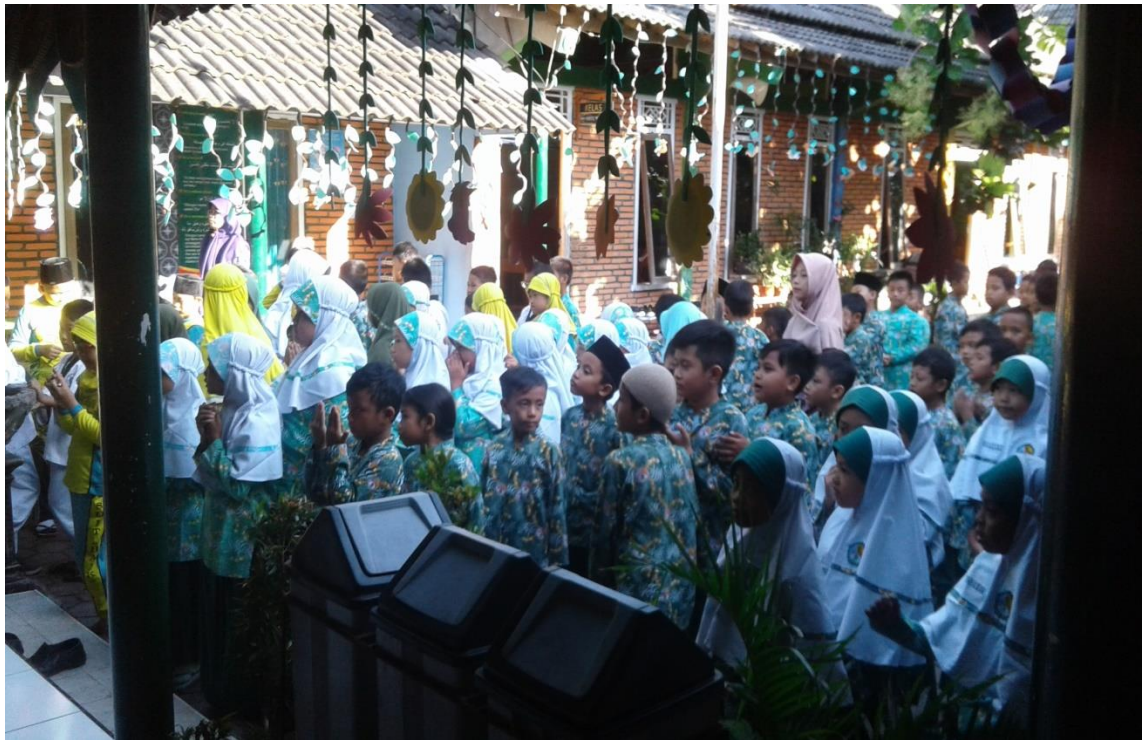
KEGIATAN APEL PAGI SISWA DAN GURU