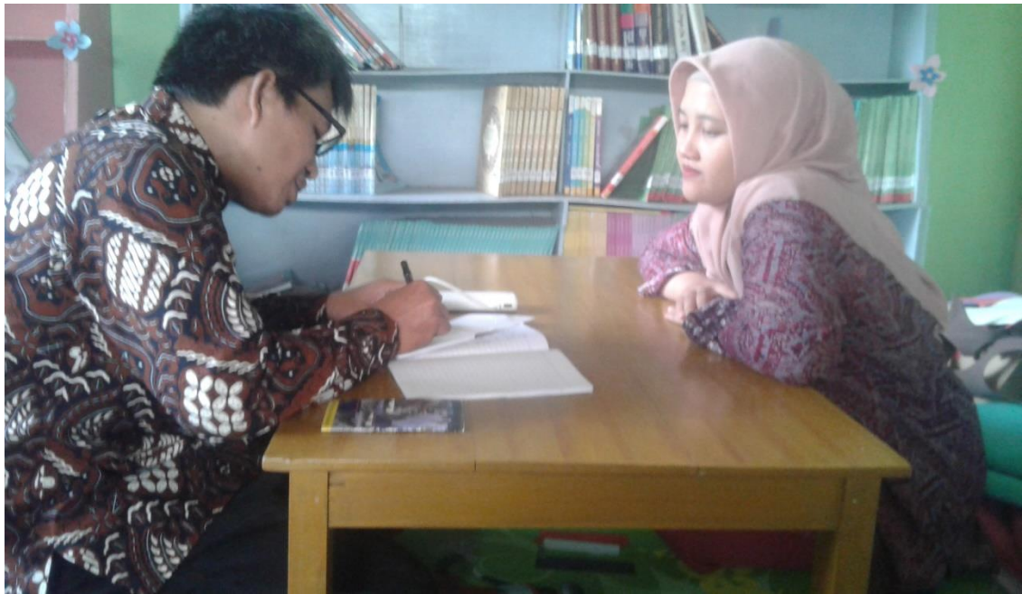
PENELITI MELAKUKAN WAWANCARA DENGAN GURU