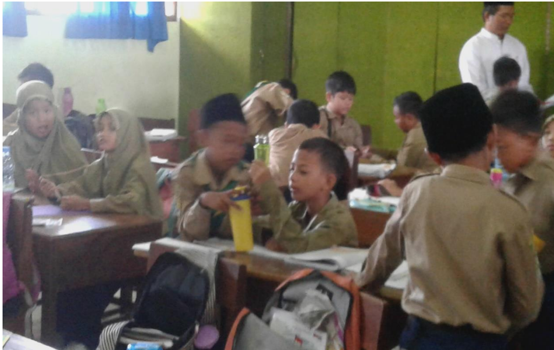
PROSES BELAJAR MENGAJAR PADA SIANG HARI