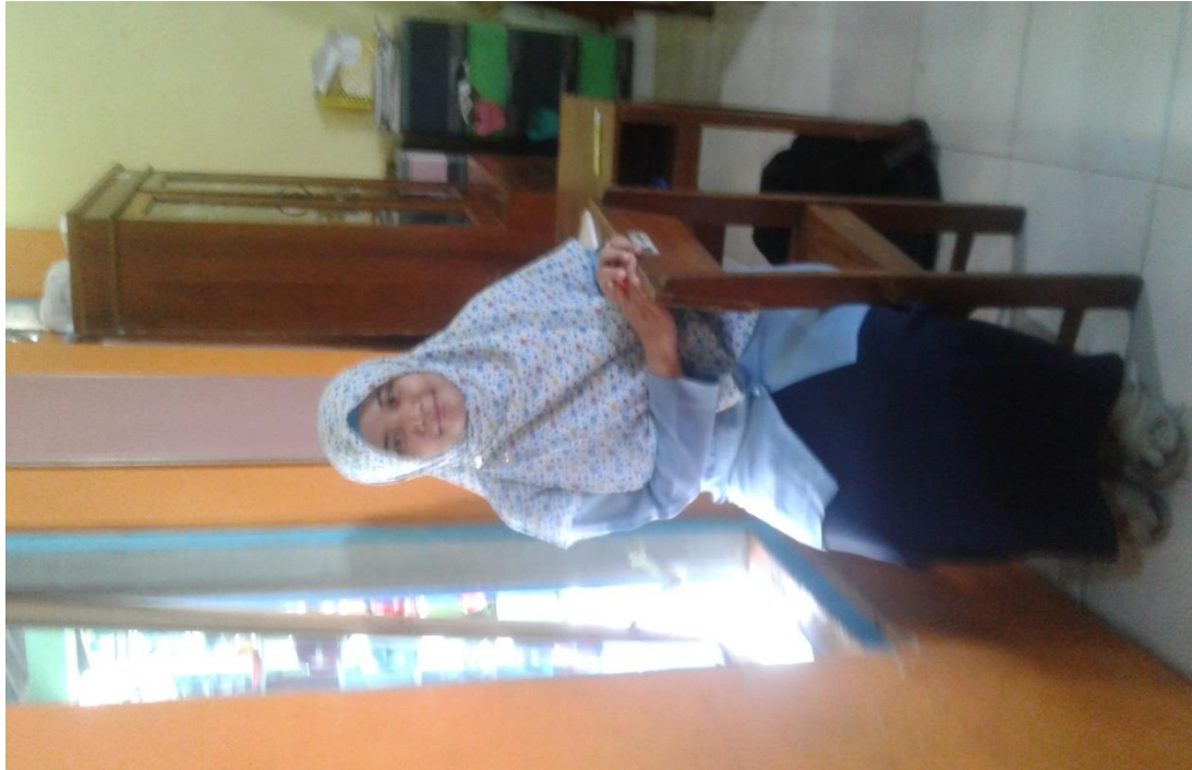
WAWANCARA PENELITI DENGAN GURU KELAS