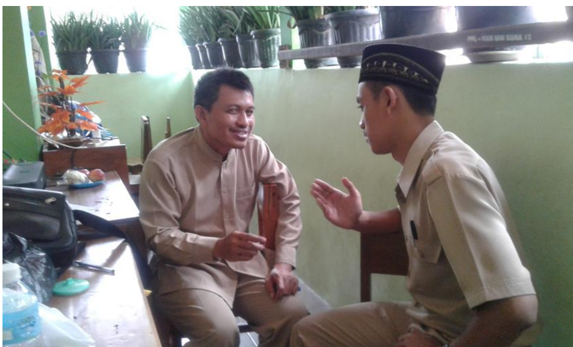
WAWANCARA PENELITI DENGAN GURU KELAS