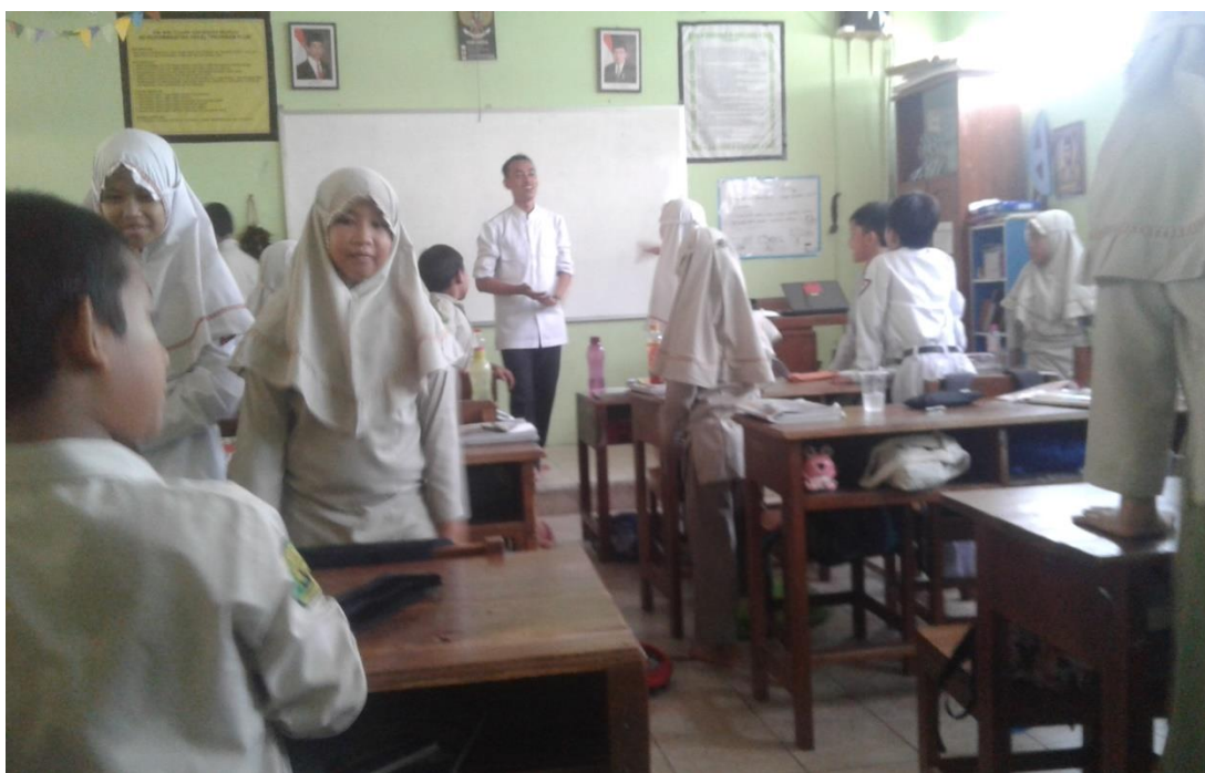
PROSES BELAJAR MENGAJAR SIANG DENGAN PROGRAM SBDP (SENI BUDAYA DAN PRAKARYA)