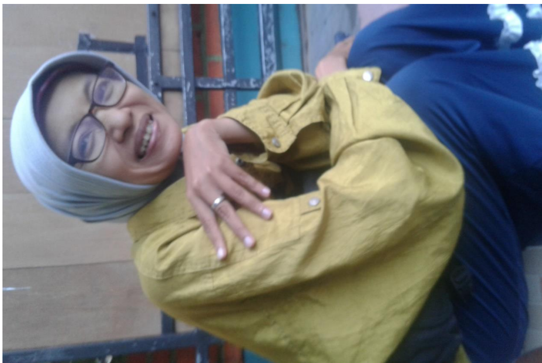
PENELITI MELAKUKAN WAWANCARA DENGAN ORANG TUA