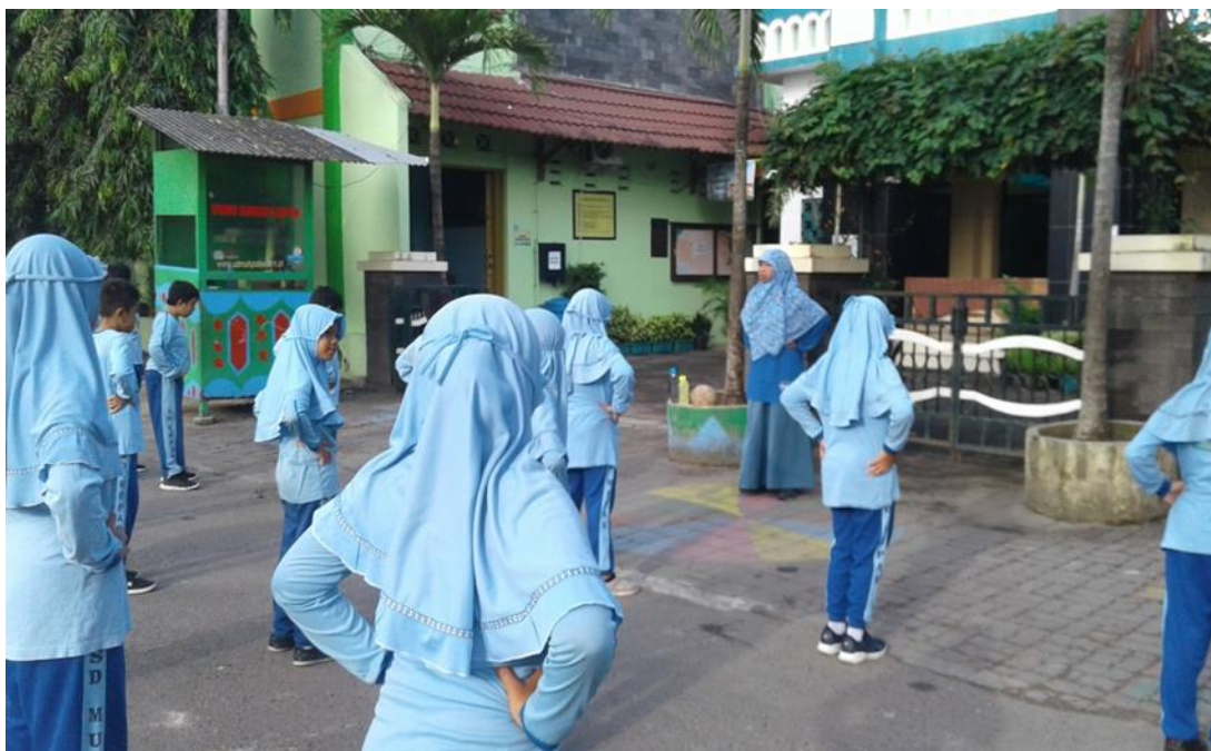
SISWA SENAM PADA SIANG HARI BAGIAN DARI PROGRAM SBDP