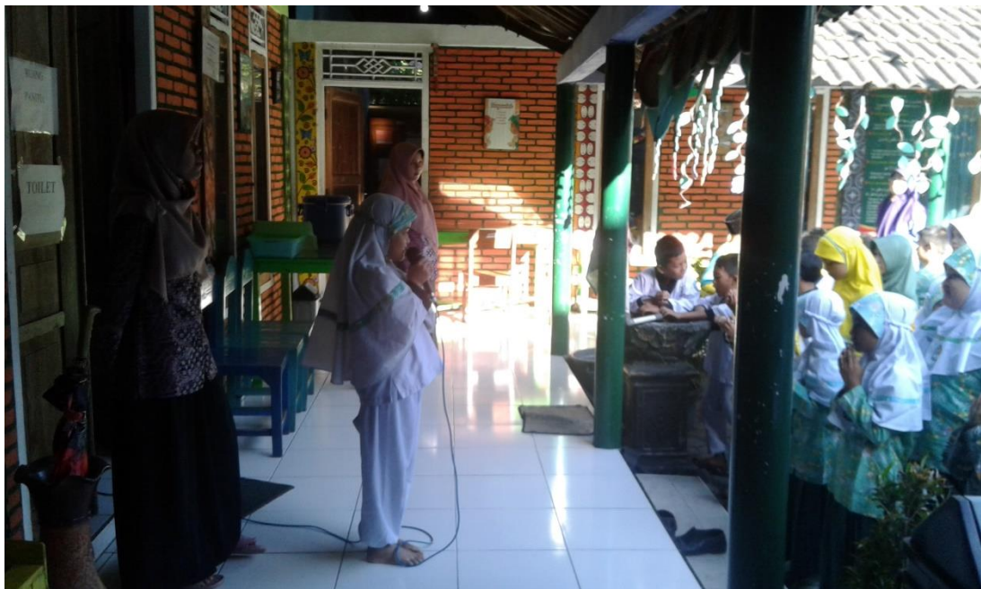
SISWI MEMANDU BERDO'A PADA APEL PAGI