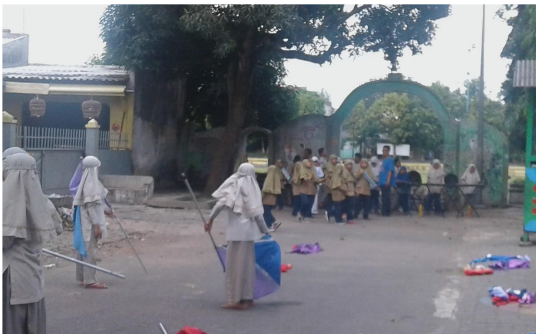
LATIHAN DRUM BAND PADA SIANG HARI BAGIAN PROGRAM SBDP