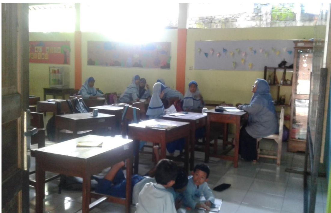
KEGIATAN BELAJAR MENGAJAR SIANG - SOR