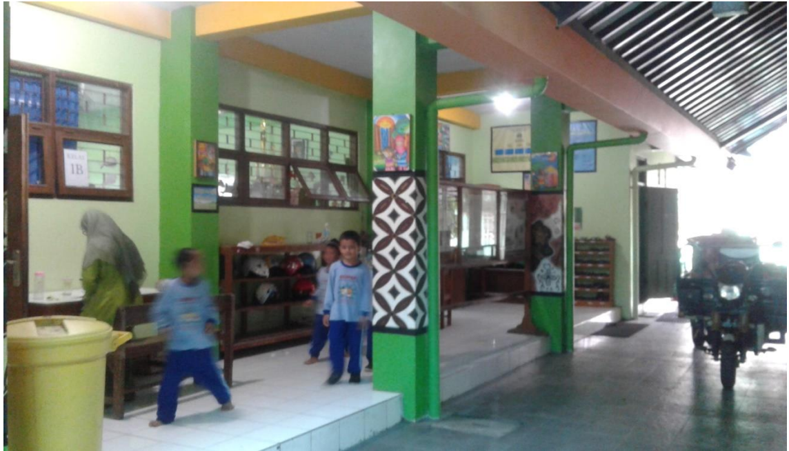
SUASANA SALAH SATU SUDUT SEKOLAH YANG NYAMAN