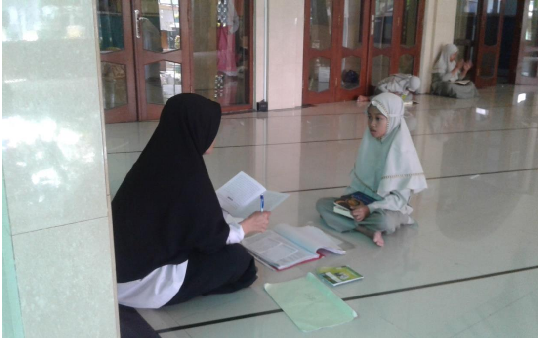
MUROJA'AH HAFALN JUZ'AMMA