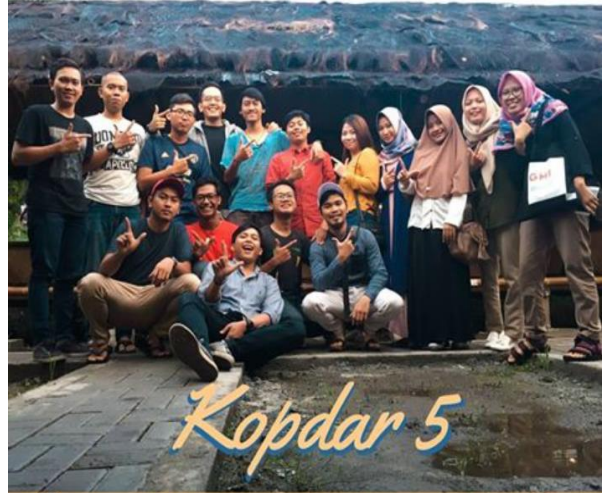
DAERAH ISTIMEWA YOGYAKARTA