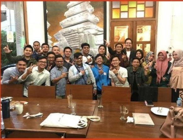
Kopdar Pertama D.I. Yogyakarta