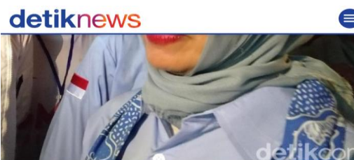
Nur Asia Uno

Yogyakarta - Istri Cawapres Sandiaga Uno, Nur Asia, mengajak masyarakat terutama kalangan milenial untuk tak golput di Pemilu 2019. Dia meminta masyarakat berpartisipasi dan mengawal jalannya Pemilu nanti.