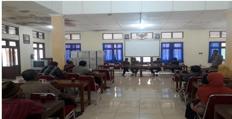
Gambar 1.2 Proses Lelang Tanah Kas Desa

Penyewaan tanah kas desa ini dilakukan dengan sistem lelang umum, sehingga dalam pelaksanaan sistem lelang umum ini dilaksanakan dengan sistem terbuka yang dimana dalam proses penyewaannya tanah kas desa dilaksanakan secara terbuka serta bertanggungjawab.