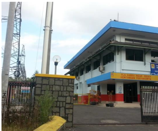
Gambar 3.1 PT. PLN (Persero) Gardu Induk 150 kV Kentungan

Tempat : PT. PLN (Persero) Gardu Induk 150 KV Kentungan Alamat : Jl. Kaliurang Km. 7,8, Sinduharjo, Sleman, Kabupaten Sleman, Daerah Istimewa Yogyakarta 55188 Tanggal : 13 Mei 2019 – 17 Mei 2019