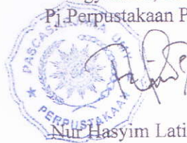
Nur Hasyim Latif, SIP