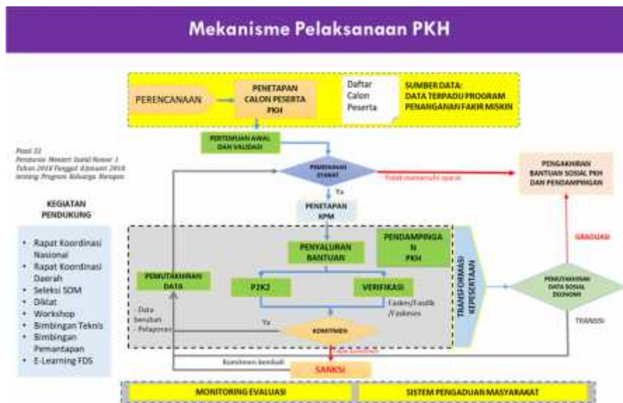
Tabel 5. Mekanisme pelaksanaan PKH.

Sumber : https://pkh.kemsos.go.id/?pg=tentangpkh-2 pukul 23.15 Wib Dengan adanya PKH ini dapat membantu menurunkan angka kemiskinan warga masyarakat, selain karena besarnya anggaran untuk PKH, KPM PKH juga didampingi oleh tim anggota pendamping PKH. Selain mendampingi dan