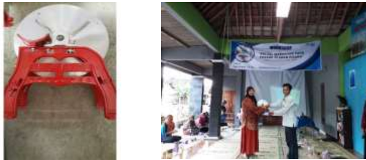
Gambar 3. Pengadaan Alat Pemotong Bonggol Pisang

Kegiatan ini dilakukan karena dalam pembuatan kripik bonggol pisang ibu - ibu PKK masih menggunakan tenaga manual sehingga waktu pembuatan kripik bonggol pisang kurang efisien, selain itu resiko cedera tangan lebih tinggi ketika pemotongan dilakukan secara manual. Dari segi ketebalan juga kurang tipis ketika pemotongan dilakukan secara manual. Untuk itu kami memberikan bantuan alat pemotong agar lebih efisien dari segi waktu dan dapat menekan biaya produksi karena mampu mengurangi penggunaan tenaga kerja dalam pemotongan kripik bonggol pisang ini sehingga harga produksi lebih rendah. Spesifikasi alat pemotong yang kami berikan berbahan dasar besi baja dengan mata pisau sejumlah 4 dengan tinggi alat 40 cm.