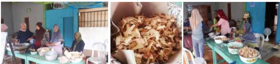
Gambar 2. Dokumentasi Kegiatan Penelusuran Proses Produksi

Kegiatan ini dilaksanakan dalam 2 kali yaitu pertama pada tanggal 26 Januari 2019 hingga 29 Januari 2019 dan pada praktek kedua yaitu pada tanggal 5 Februari 2019 - 8 Februari 2019. Proses pembuatan kripik bonggol pisang ini diawali dengan pencarian bonggol pisang yang sesuai dengan kriteria yaitu bonggol pisang kepok, setelah itu bonggol pisang dipotong menjadi kotak-kotak lalu dibersihkan dan direndam menggunakan air kapur selama sehari semalam. Langkah selanjutnya yaitu dicuci dan dipotong - potong menjadi lembaran yang tipis-tipis menggunakan alat pemotong. Setelah itu baru dicampur dengan adonan tepung trigu, tepung tapioka, telur, santan dan rempah-rempah kemudian digoreng selama 2 kali penggorengan baru setelah kripik dingin dilakukan pengemasan