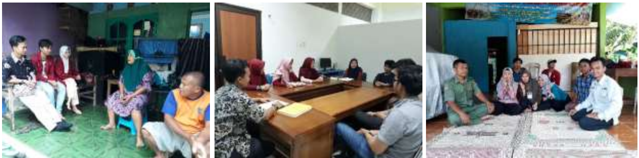
Gambar 1. Dokumentasi Kegiatan Observasi dan Kordinasi Penyusunan Program

Setelah dilaksanakan survey dan identifikasi kondisi wilayah, selanjutnya dilaksanakan kordinasi penyusunan program baik di tingkat tim pengabdian maupun dengan warga dan tokoh masyarakat tentang program yang akan dilaksanakan.