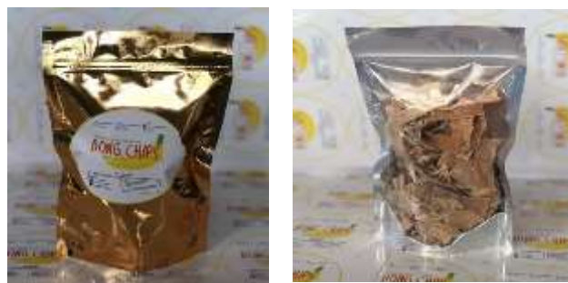
Gambar 4. Perbaikan Kemasan (Tampak Depan dan Belakang)

Program ini bertujuan untuk memperbaiki kemasan produk kripik bonggol pisang agar lebih menarik dan sesuai dengan segmen pasar yang dituju. Dalam pelaksanaan program ini dilakukan editing pada logo serta kemasan kripik bonggol pisang. Plastik kemasan yang digunakan berbahan dasar alumunium yang di pres dibagian atasnya menggunakan alat pres agar kripik kedap udara dan bisa tahan lama. Selain itu juga dilakukan perbaikan dalam hal kemasan terkait tanggal kadaluarsa yang mana pada kemasan sebelumnya tidak memuat tanggal kadaluarsa, hal ini dilakukan agar konsumen tidak merasa khawatir ketika mengkonsumsi kripik bonggol pisang.