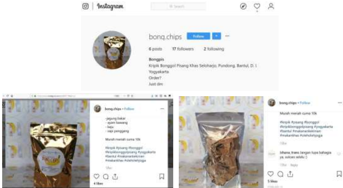
Gambar 6. Akun Sosial Media Instagram @bong.chips

pengurusan P-IRT hingga diperoleh sertifikat itu dan bisa dicantumkan di kemasan produk yang dijual.