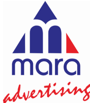
Gambar 8. Logo PT. Mara Advertising

MARA didirikan di Yogyakarta pada tanggal 25 Maret 1984 dengan nama MARA VISUAL ART. Mengawali usahanya, MARA VISUAL ART bergerak dalam bidang jasa periklanan yang khusus menangani promosi media luar ruang. Dalam perkembangannya, pada tanggal 22 Desember 1990 MARA VISUAL ART melebarkan bentuk usaha dan berganti nama menjadi MARA Advertising, sekaligus menempati kantor baru di Jl. Mawar No.22, Baciro, Yogyakarta. MARA sangat konsen terhadap perkembangan industri periklanan di daerah. Kekuatan lokal diyakini memiliki potensi dan daya saing yang tinggi untuk menghasilkan berbagai karya kreatif yang berkualitas, yang diharapkan dapat memberikan kontribusi yang besar bagi kemajuan industri periklanan di Indonesia. Sampai dengan usia yang ke-35, MARA telah memperluas layanannya sebagai full service agency. Selain promosi media luar ruang,