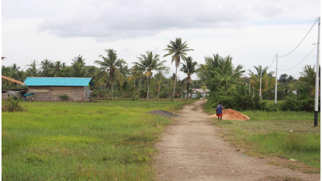
Kondisi Infrastruktur Jalan Desa Warmon Kokoda.