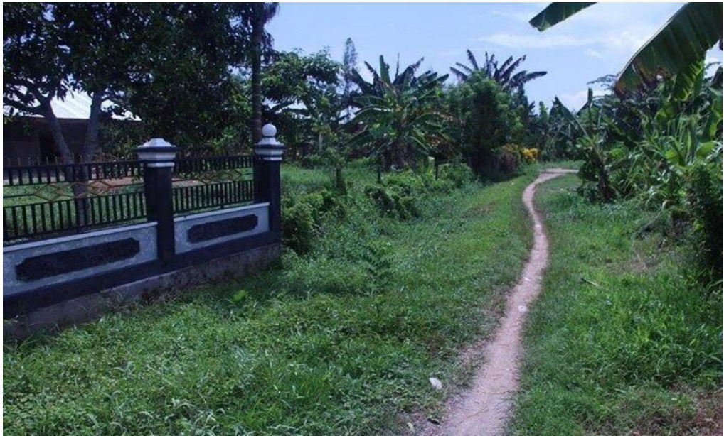
Kondisi Batas Wilayah Pemukiman Warga Transmigran dan Warga Desa Warmon Kokoda.