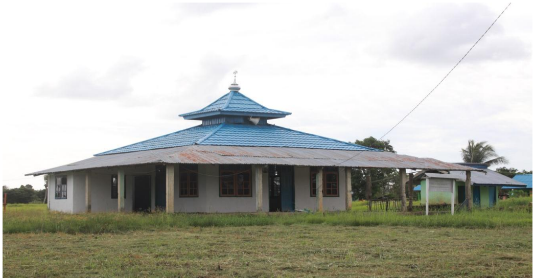
Kondisi Masjid Desa Warmon Kokoda.