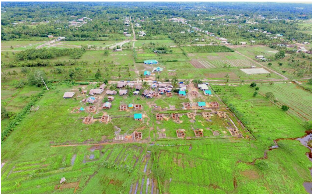
Kondisi Wilayah Desa Warmon Kokoda.