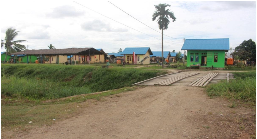
Kondisi Infrastruktur Jembatan Desa Warmon Kokoda.

Berdasarkan observasi yang dilakukan, pembangunan di Desa Warmon Kokoda belum berjalan lancar. Seperti infrastruktur jalan,