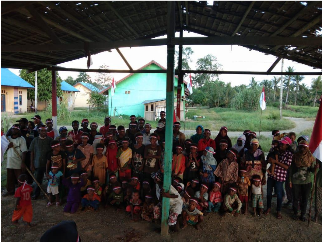
Kondisi Balai Pertemuan Desa/Rumah Adat Warmon Kokoda.