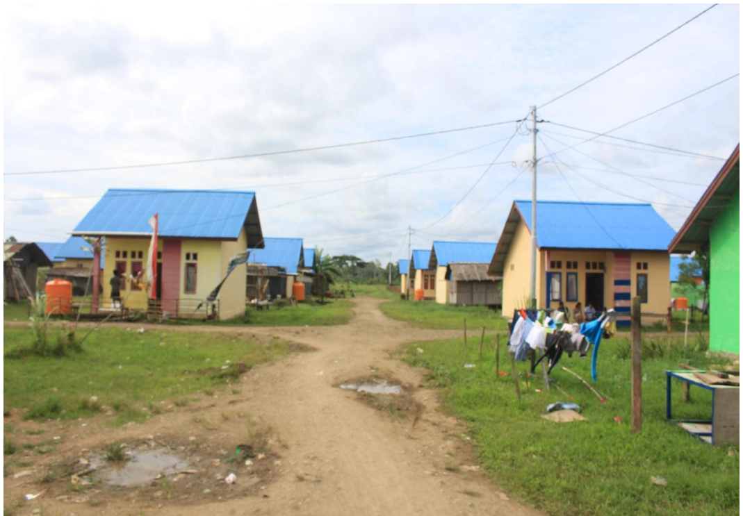
Kondisi Pemukiman Warga Desa Warmon Kokoda.