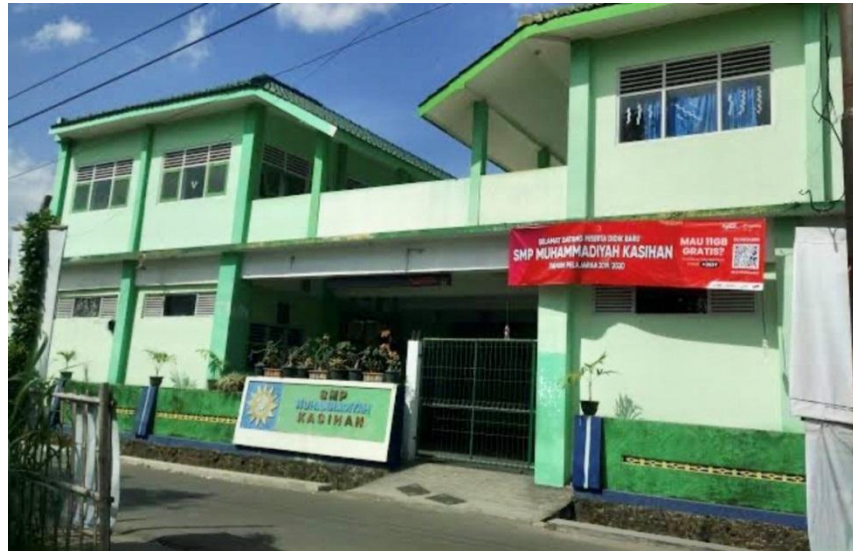
(SMP Muhammadiyah Kasihan)