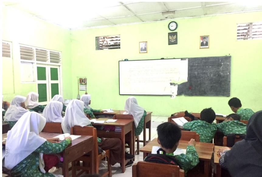
(Mengajar di kelas VII B)