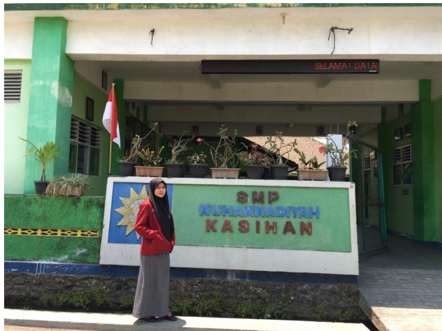
(depan SMP Muhammadiyah Kasihan)