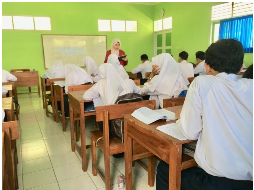
(Mengajar di kelas VII A)