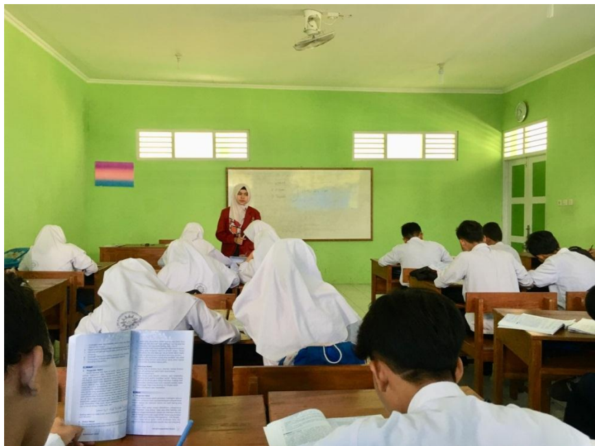
(Mengajar di kelas VII C)