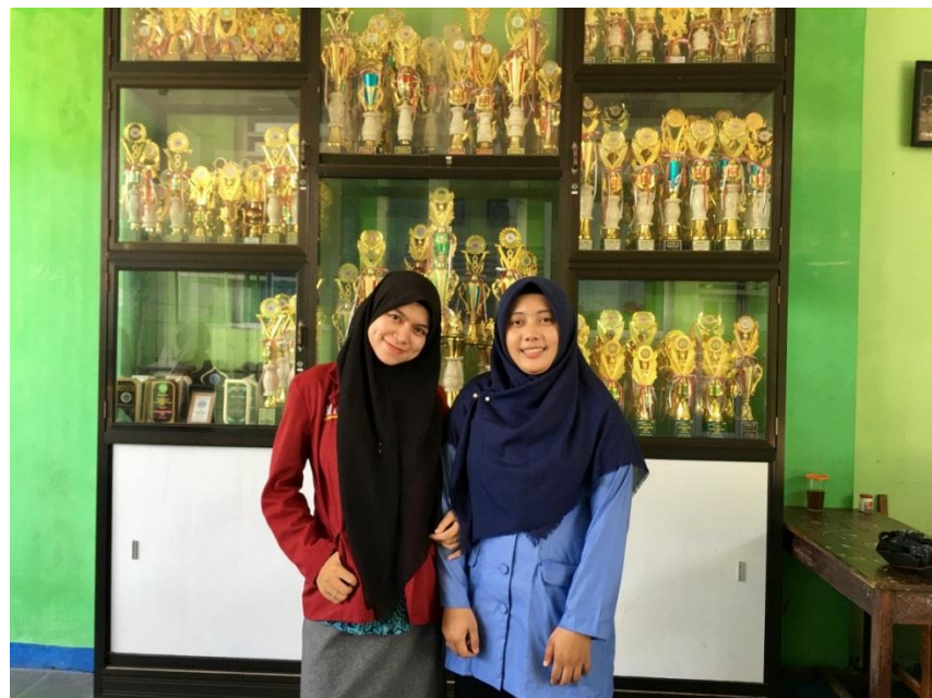
(Bersama guru Tarikh SMP Muhammadiyah Kasihan)