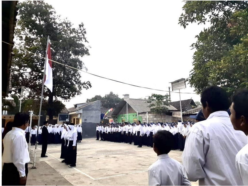
(proses upacara bendera)