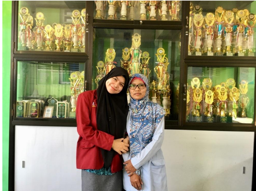
(Bersama Ibu Waka Kurikulum SMP Muhammadiyah Kasihan)