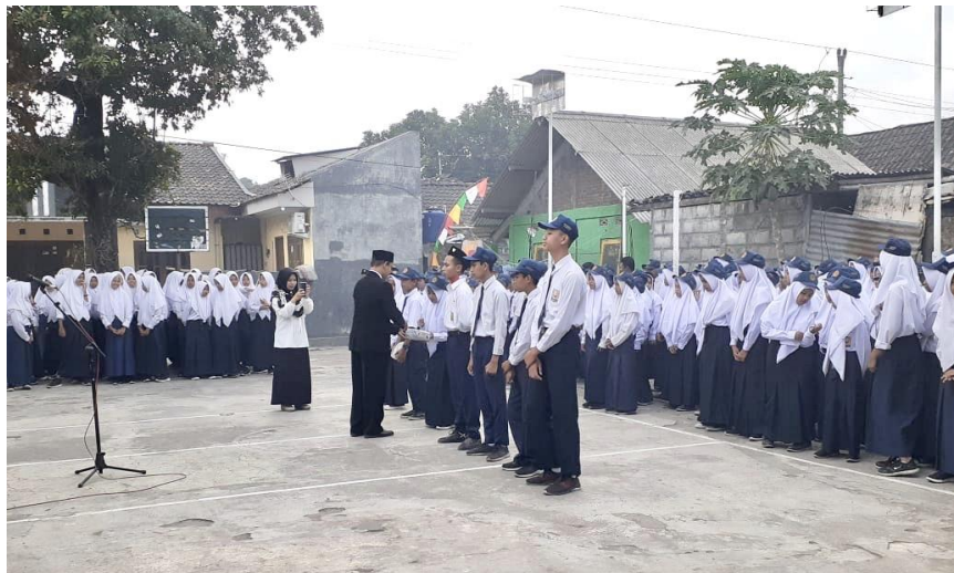
(Proses pemberian hadiah setelah upacara bendera)