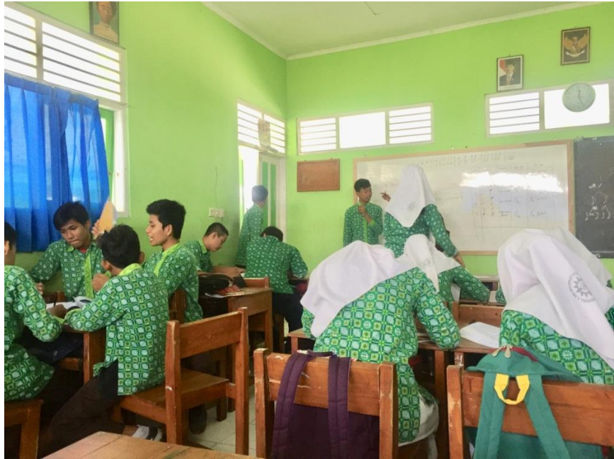
(Mengerjakan tugas VII B)