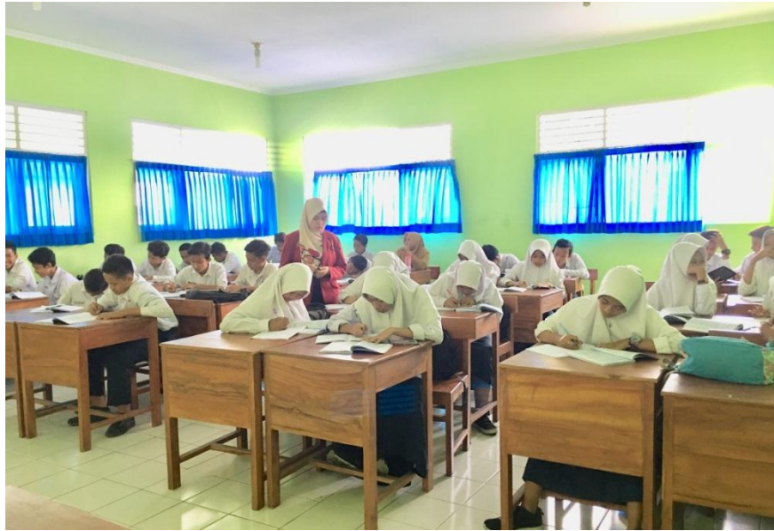
(Mengajar Tarikh di kelas VII A)