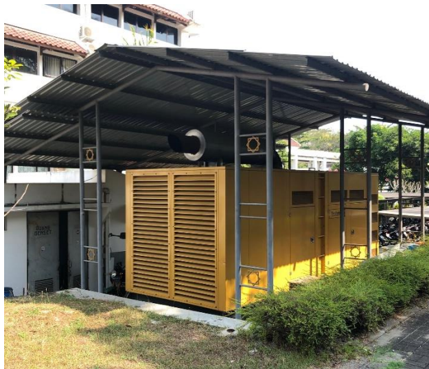
Gambar 4. 17 Generator