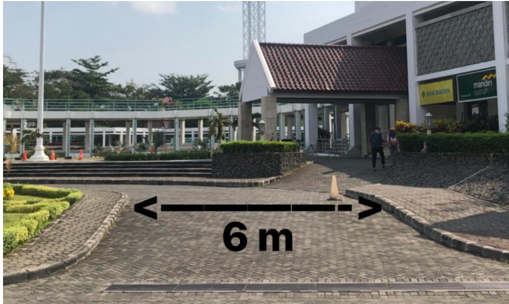
Gambar 4. 2 Jalan lingkungan