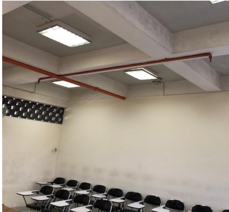
Gambar 4. 14 Springkler