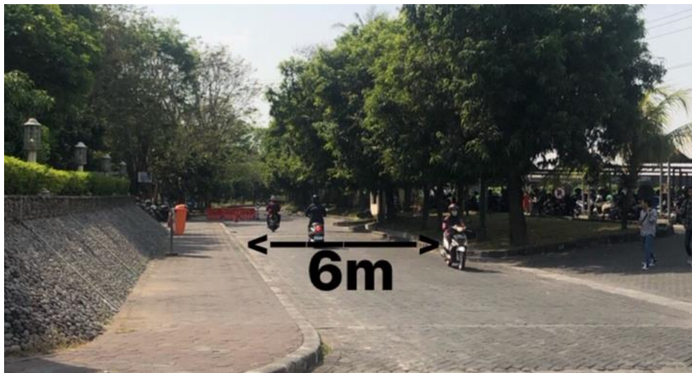
Gambar 4. 3 Jalan lingkungan