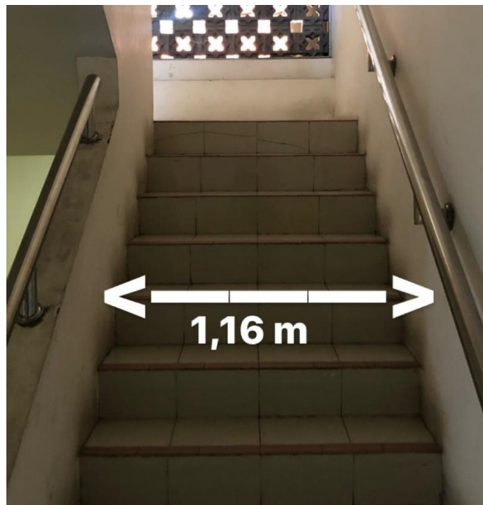
Gambar 4. 9 Konstruksi jalan keluar