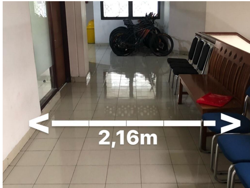
Gambar 4. 7 Jalan keluar