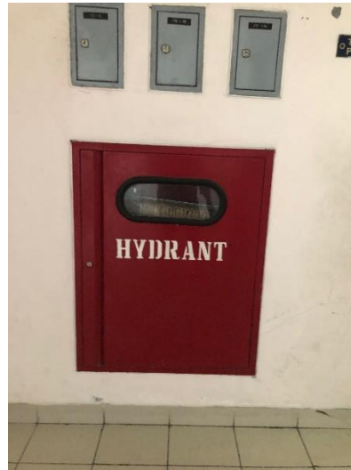
Gambar 4. 13 Hidran gedung