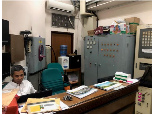
Gambar 4. 18 Ruang pengendali operasi