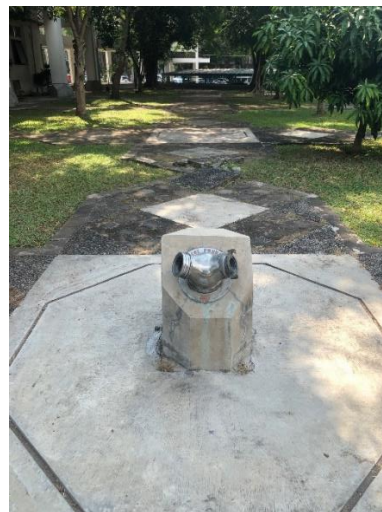
Gambar 4. 11 Siames connection