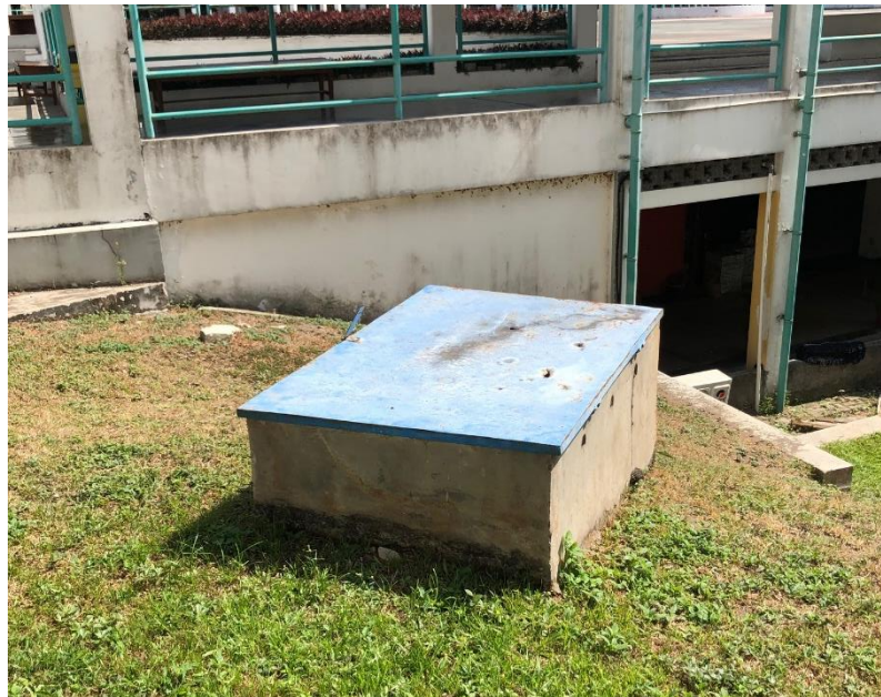
Gambar 4. 1 Sumber air