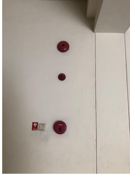
Gambar 4. 10 Deteksi dan alarm