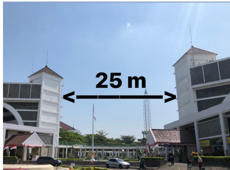
Gambar 4. 4Jarak antar bangunan