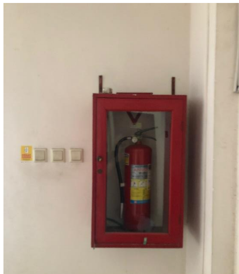
Gambar 4. 12 Pemadam api ringan