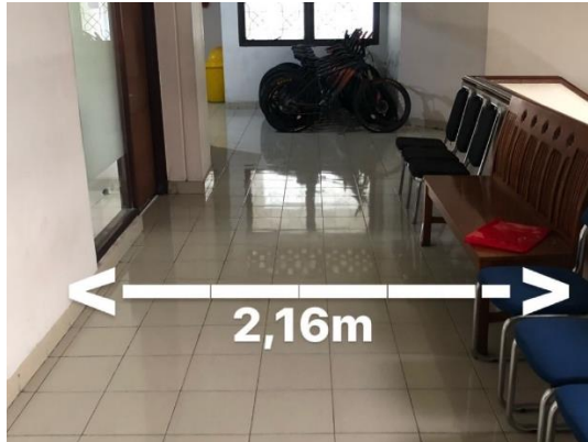
Gambar 4. 8 Konstruksi jalan keluar