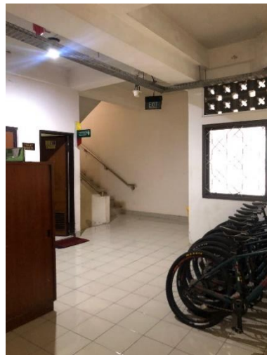
Gambar 4. 6 Jalan keluar