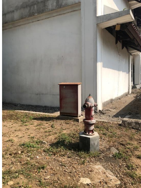
Gambar 4. 5 Hidran halaman