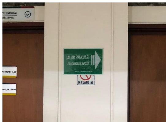
Gambar 4. 16 petunjuk arah