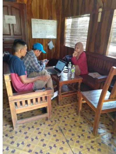
Wawancara dengan Pemuda Desa Terong