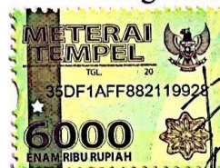
Intan Fatimah Putri