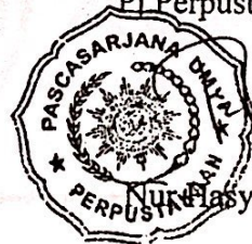
Nur Hasyim Latif, SIP