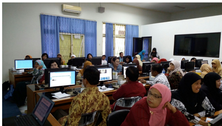
Gambar 2 Guru-guru mempraktekkan penggunaan berbagai platform media