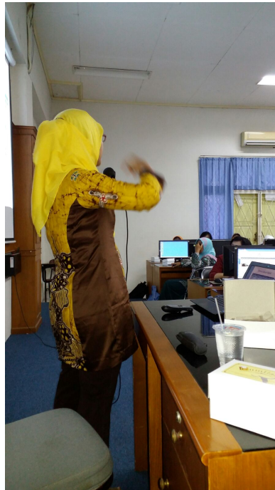
Gambar 1 Penjelasan dalam penggunaan berbagai platform media digital

Berbagai platform di atas diperkenalkan kepada guru-guru seni dan pelatih workshop memberikan contoh di laboratorium komputer digital, dengan demikian guru-guru juga dapat langsung mempraktekkan kegunaan masing-masing media.