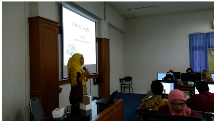
Gambar 3 Pemaparan mengenai 7 komponen literasi media

Ada dua jalur yang dapat digunakan yaitu pendidikan sekolah (formal) dan masyarakat (informal dan non formal). Di sekolah, literasi digital dapat dimasukkan ke dalam beberapa mata pelajaran seperti bahasa, Ilmu Pengetahuan Sosial (IPS), kesehatan dan komputer (Herlina, 2015), untuk itulah pelaksanaan pelatihan seperti ini harus selalu ditingkatkan.