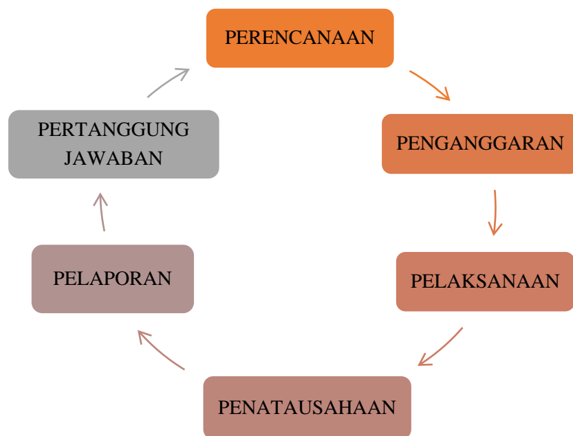
Gambar II.2 Siklus Pengelolaan Keuangan Desa 22

dengan uang serta segala sesuatu berupa uang dan barang yang berhubungan dengan pelaksanaan hak dan kewajiban desa. Hak dan kewajiban tersebut menimbulkan pendapatan, belanja, pembiayaan, dan pengelolaan keuangan desa. Pengelolaan keuangan desa dilaksanakan berdasarkan siklus seperti pada Gambar II.2 berikut.