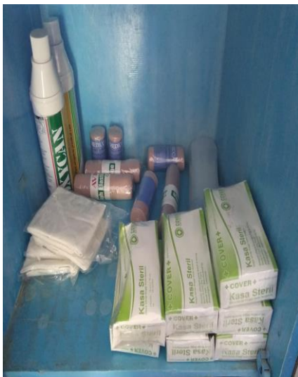
Gambar 7 Oksigen, Kassa, dan Perban