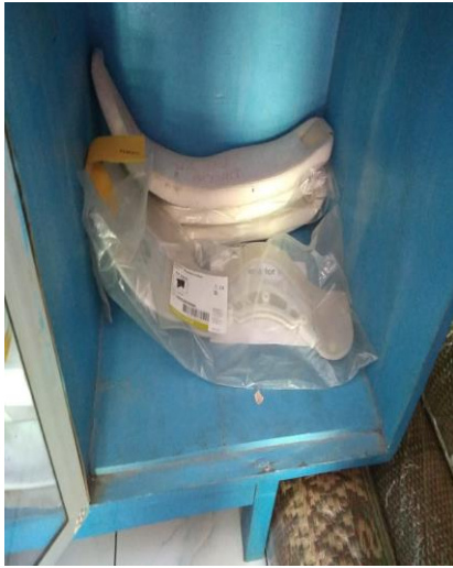
Gambar 5 Alat pengikat patah tulang