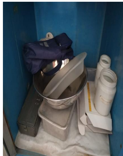
Gambar 8 Alat Tensi