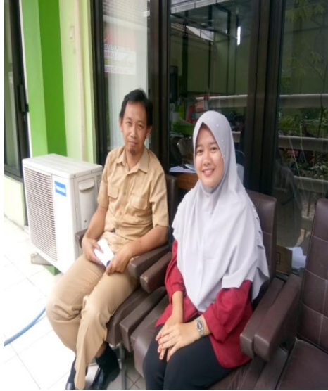
Gambar 4. Kecamatan Tegalrejo