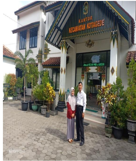
Gambar 5. Kecamatan Kotagede