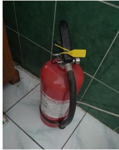
Gambar 6 Alat Pemadam Kebakaran (Akar)