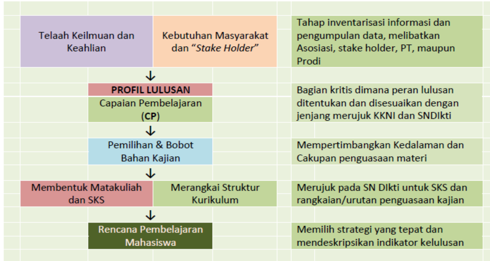
Diagram Alur Penyusunan KPT