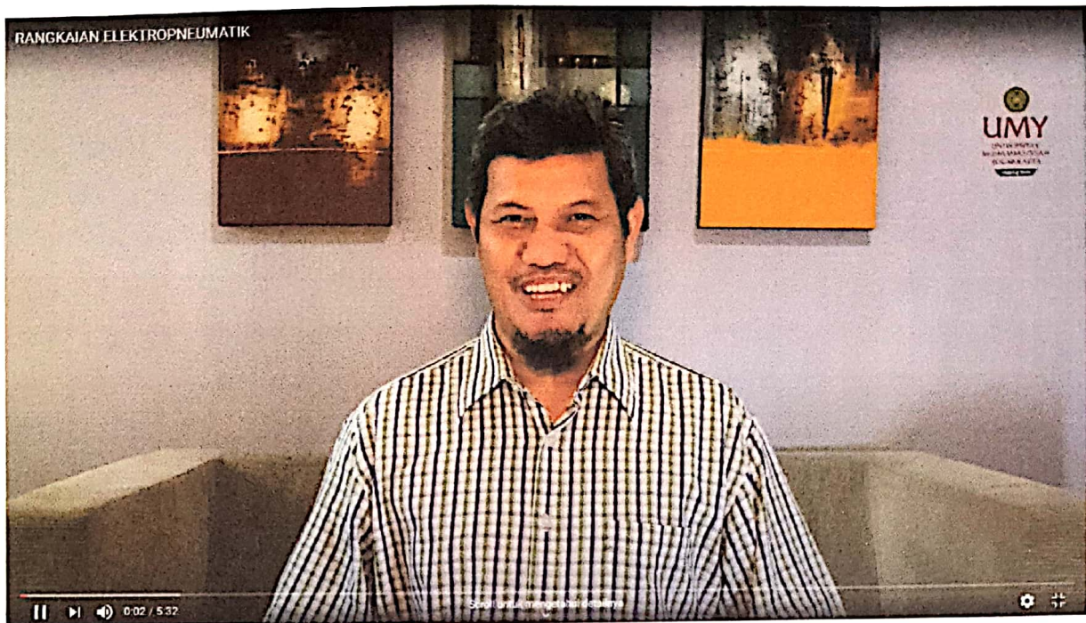
Screenshot Video "Rangkaian Elektropneumatik"