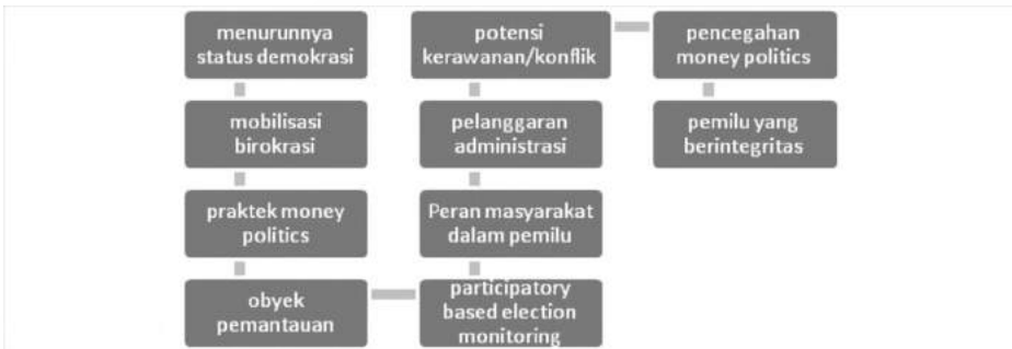
Bagan 1 . Peta kajian pengawasan pemilu secara partisipatif

Setiap pelaksanaan pemilu, beragam LSM pemantau pemilu telah banyak terlibat memperkuat demokrasi dan kualitas elektoral, namun masih diperlukan penguatan yaitu dengan melibatkan peran perguruan tinggi dalam pengawasan pemilu partisipatif tersebut. Perguruan Tinggi yang memiliki sumber daya manusia yaitu dosen dan mahasiswa, menjadi pilar penting dalam pengawasan pemilu partisipatif pada pemilu 2019. Kolaborasi dalam pengawasan pemilu yang dilakukan oleh penyelenggara pemilu dengan perguruan tinggi, dalam hal ini dilakukan oleh UMY, merupakan kontribusi nyata praktek pengawasan pemilu partisipatif untuk mendukung pemilu yang berintegritas. Riset KKN Tematik Pengawasan Pemilu Partisipatif yang dilakukan oleh UMY melengkapi berbagai studi yang telah dilakukan sebelumnya dari aspek model kolaborasi, peran multi stakeholder serta Menjadi referensi bagi Perguruan Tinggi, Bawaslu dan Pemerintah Desa dalam berkolaborasi merumuskan Kuliah Kerja Nyata (KKN) Tematik sebagai salah satu model pengawasan partisipatif menjadi