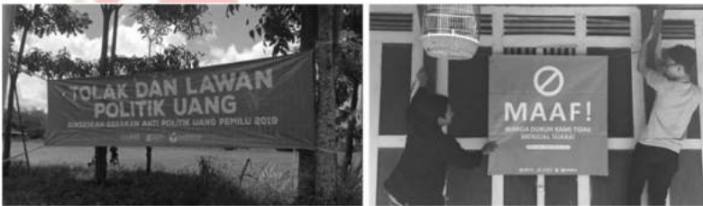
Gambar 7. Pemasangan Alat Peraga/Poster

Program pembuatan dan pemasangan alat peraga juga merupakan salah satu kegiatan yang sangat positif dan sangat efektif untuk menolak politik uang. Dengan adanya program atau kegiatan ini diharapkan bisa menggerakkan masyarakat untuk mulai menolak politik uang. Dengan adanya alat peraga atau poster yang disebarluaskan secara luas akan menjadi salah satu alat bagi masyarakat untuk melakukan penolakan terhadap politik uang. Dimana alat peraga ini sangat mudah sekali untuk dipasang di setiap rumah atau tempat-tempat strategis, sehingga bisa menjadi alat untuk penolakan terhadap politik uang. Jika program ini dilakukan diseluruh Indonesia maka akan sangat bagus sekali untuk menggerakkan secara masal penolakan terhadap politik uang dan akan bagus bagi pemilu Indonesia kedepan.