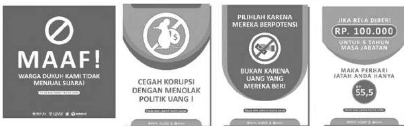
Gambar 8. Contoh Alat Peraga

strategis dan dapat dilihat oleh orang banyak. Dimana dengan adanya alat peraga di berbagai media baik offline maupun online tersebut maka akan sangat membantu masyarakat dalam penambahan wawasan atau pengetahuan tentang dampak negative politik uang. Dokumentasi kegiatan ini masih ramai di sosial media Instagram dan video yang diupload di youtube sebagai kegiatan wajib KKN.