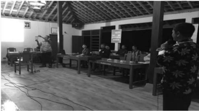
Gambar 10. Sosialisasi Tata Cara Pencoblosan