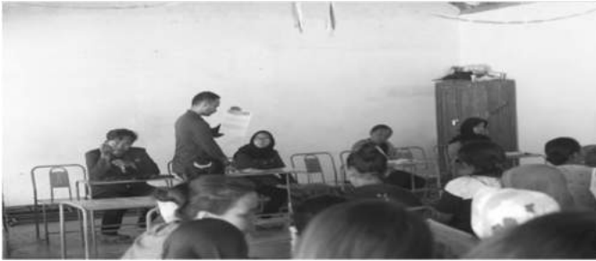
Gambar 11. Sosialisasi Pemilih Pemula