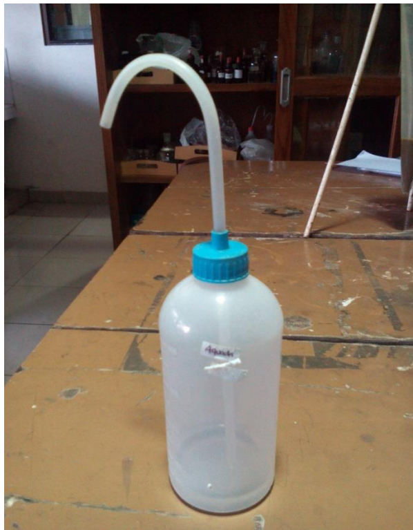
Lampiran 10. Air aquades