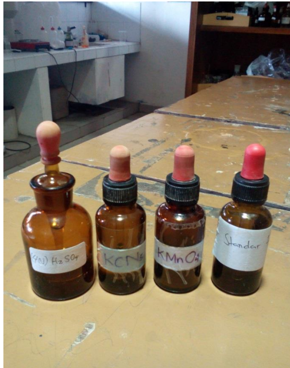
Lampiran 7. Larutan H 2 SO 4 , KCN 5 , KMnO 4 , dan Standart Fe untuk pemeriksaan kadar Fe