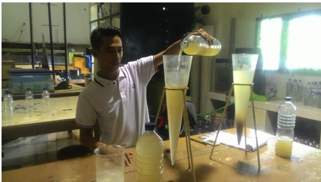
Lampiran 6. Pemeriksaan kadar lumpur tersuspensi