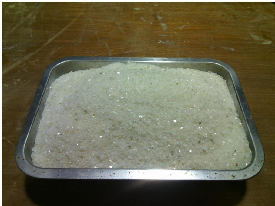
Lampiran 4. Pasir silika