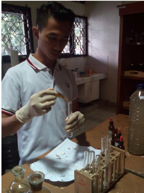
Lampiran 5. Pemeriksaan kadar Fe