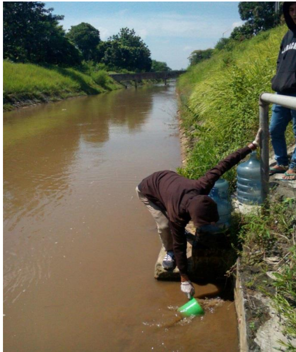
Lampiran 1. Pengambilan air sampel