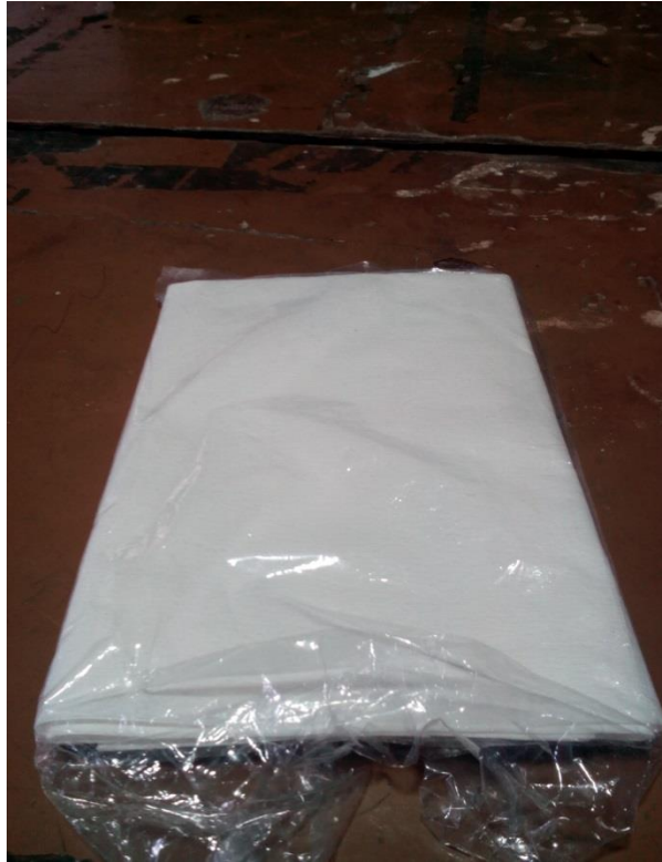
Lampiran 9. Kertas saring untuk pemeriksaan kadar lumpur tersuspensi.