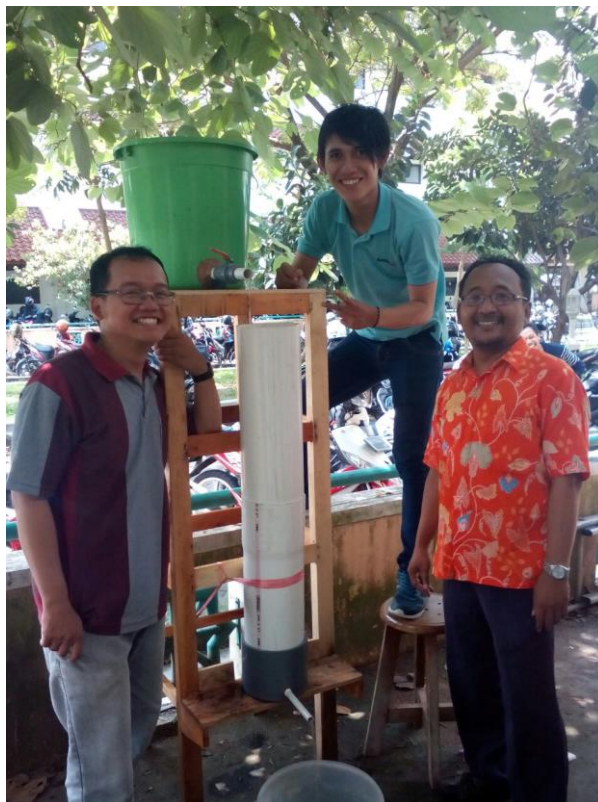
Lampiran 2. Alat uji penyaringan