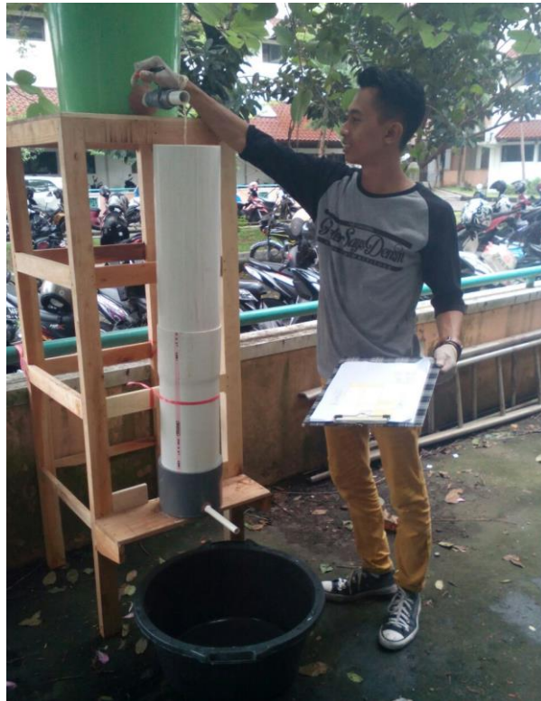
Lampiran 3. Proses penyaringan