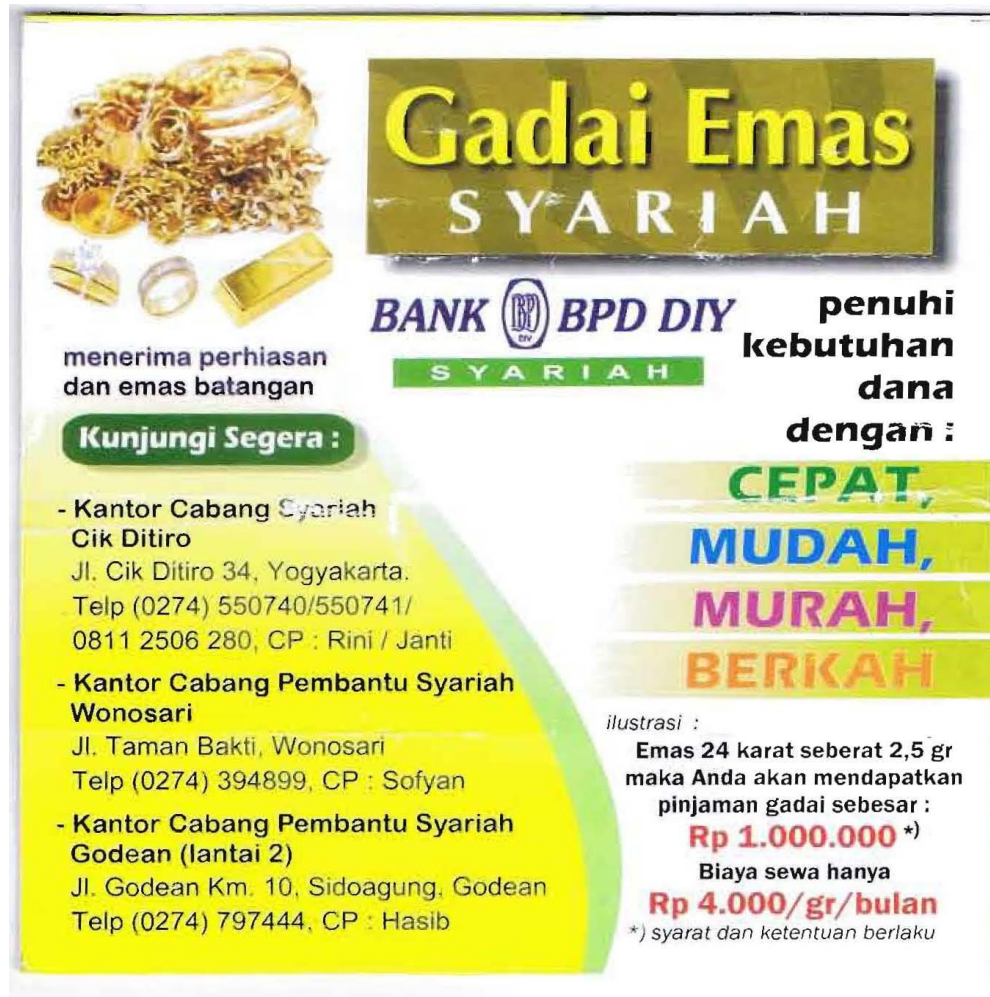
Lampiran 1 Brosur Gadai Emas Syariah Pada Bank BPD DIY Syariah