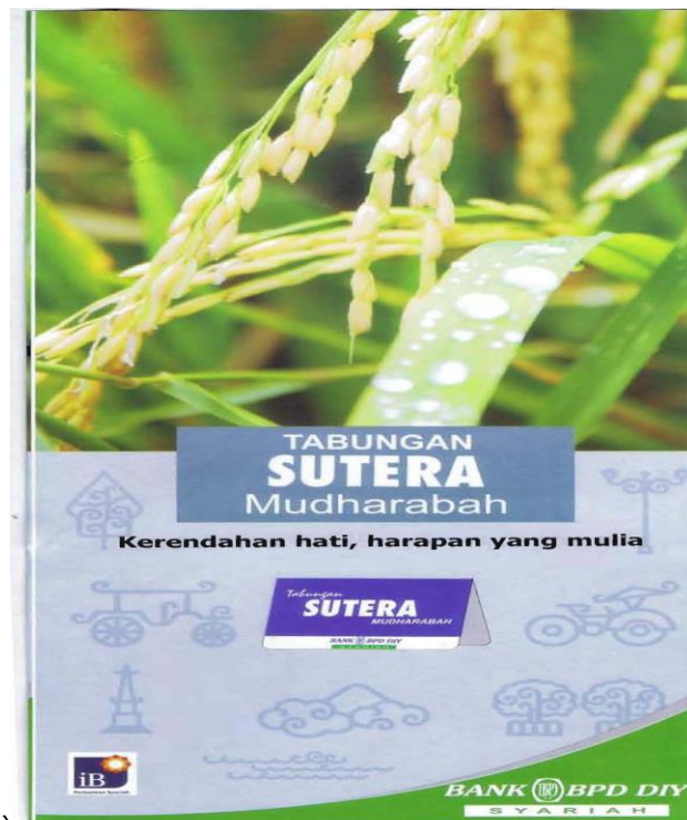
Lampiran 4 Brosur Tabungan Sutera Mudharabah