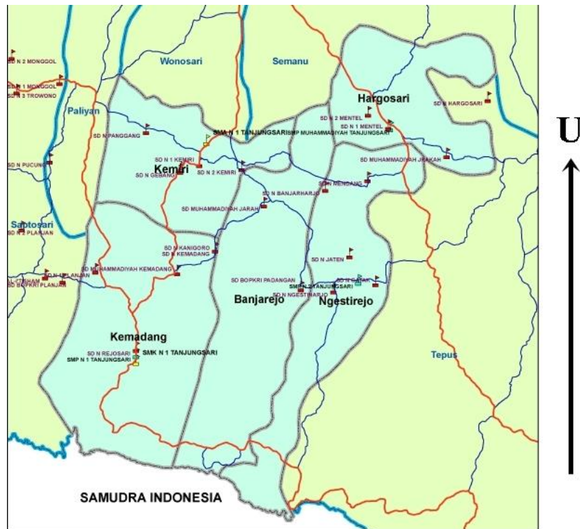
Gambar 19. Peta administrasi Kecamatan Tanjungsari

Berdasarkan pembagian wilayah padukuhan, jumlah RW dan RT Kecamatan Tanjungsari dapat dilihat pada tabel 2 berikut.