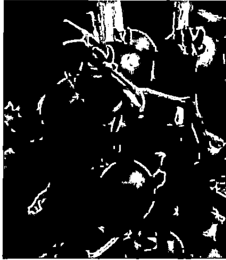
Gambar 1. Buah Tomat ( Lycopersicum esculentum Mill.)

Berdasarkan bentuk buahnya, tanaman tomat dibagi menjadi beberapa jenis yaitu tomat biasa yang bentuk buahnya bulat pipih, tomat apel dan tomat kentang yang berbentuk bulat besar, tomat keriting dengan buahnya yang sedikit lonjong dan tomat cerry yang bentuk buahnya bulat dan kecil seperti buah cerry (Rukmana, 1994). Menurut Samadi (1996), tanaman tomat memiliki banyak varietas, namun varietas yang paling banyak diminati oleh para petani adalah tomat hibrida karena produksinya yang sangat tinggi, yaitu ruby , king-kong , season red , bonanza , read cloud , girl's sweet , farmer 209 dan pricious .