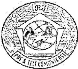
Logo PN Postel.

Pada 23 Oktober 2009, PT. TELKOM meluncurkan " New Telkom " ("Telkom baru") yang ditandai dengan penggantian identitas perusahaan.