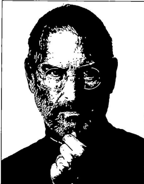
Alm. Steven Paul Jobs bin Abdulfattah Jandali 1955 - 2011

Hiduplah dalam kehidupan yang anda pilih dan jadilah atasan bagi dirimu sendiri !