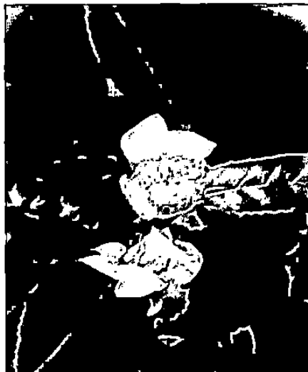
Gambar 1. Tanaman Teh Hijau