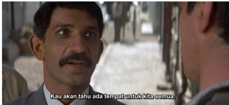
Gambar 3.6 Mahatma Gandhi bertemu dengan pemuda berkulit putih.

Pemuda Inggris : (di suatu jalan trotoar, tertawa menghina) Hei lihat siapa yang datang?