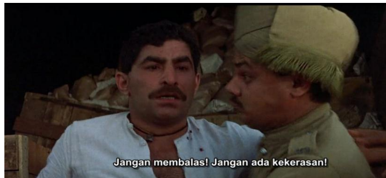
Gambar 3.8 Reaksi seseorang masyarakat India yang tidak membalas penangkapan oleh tentara Inggris.