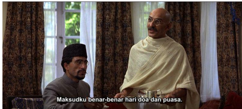
Gambar 3.1 Mahatma Gandhi bertemu anggota kongres India.

Maulana Azad : Dan perlawanan apa yang kau tawarkan?