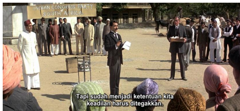
Gambar 3.5 Mahatma Gandhi berpidato dalam kongres di Afrika Selatan.

Mahatma Gandhi : (berpidato dengan suara jelas dan ekspresi wajah