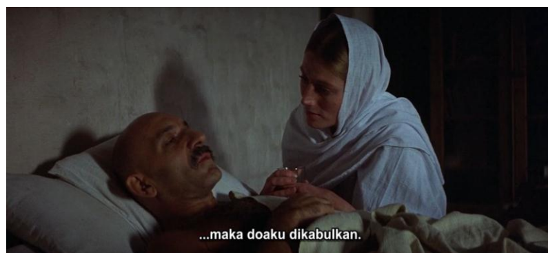
Gambar 3.3 Mahatma Gandhi berbaring ditemani Mirabehn.