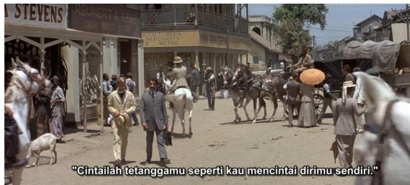
Gambar 3.7 Mahatma Gandhi sedang berjalan dengan Charlie Andrews