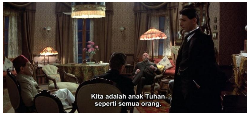
Gambar 3.4 Mahatma Gandhi berdiskusi dengan rekan pengacara di Afrika Selatan.