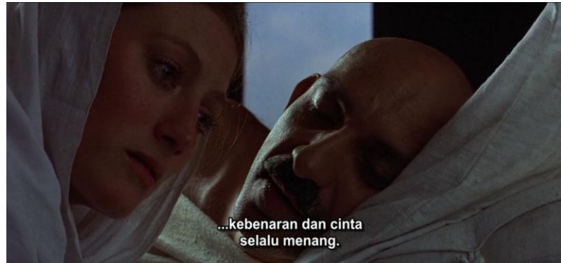
Gambar 3.9 Mahatma Gandhi memberikan nasihat kepada Mirabehn.