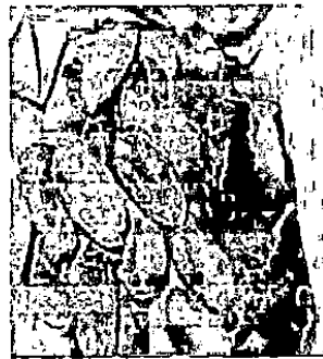
GAMBAR 1. Biji Rambutan ( Nephelium lappaceum )