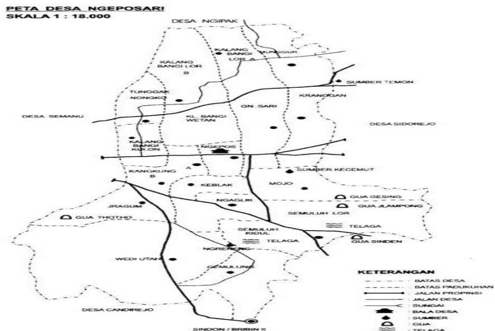
Gambar 2.1 Peta Desa Ngeposari