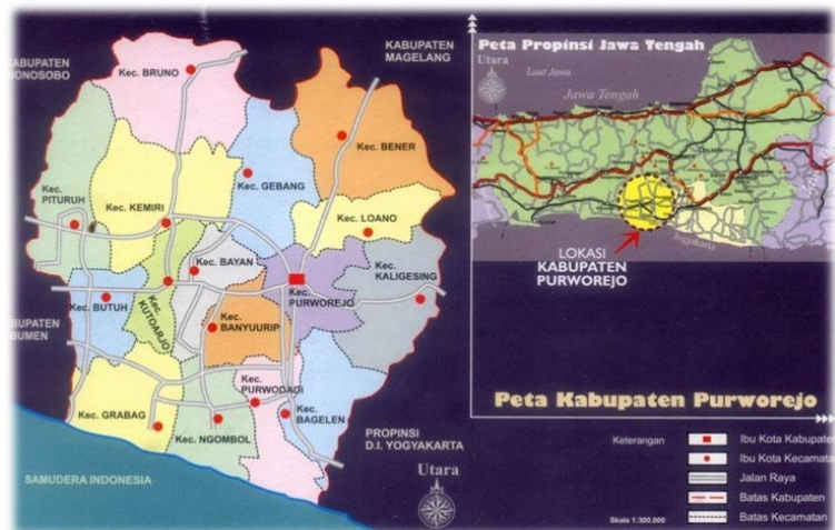
Gambar 2.1 Peta Wilayah Kabupaten Purworejo

Kabupaten Purworejo merupakan salah satu Kabupaten di Jawa Tengah yang memiliki pantai dan pegunungan. Secara astronomis Kabupaten Purworejo terletak antara 109^{\circ}47'28'' sampai 110^{\circ}8'20'' Bujur Timur dan 7^{\circ}32' sampai 7^{\circ}54' Lintang Selatan. Berdasarkan posisi geografisnya, Kabupaten Purworejo berbatasan langsung dengan Provinsi DI Yogyakarta di sebelah Timur, sebelah Barat berbatasan dengan Kabupaten Kebumen, sebelah Selatan berbatasan dengan Samudera Indonesia, dan sebelah Utara berbatasan dengan Kabupaten Magelang dan Wonosobo.