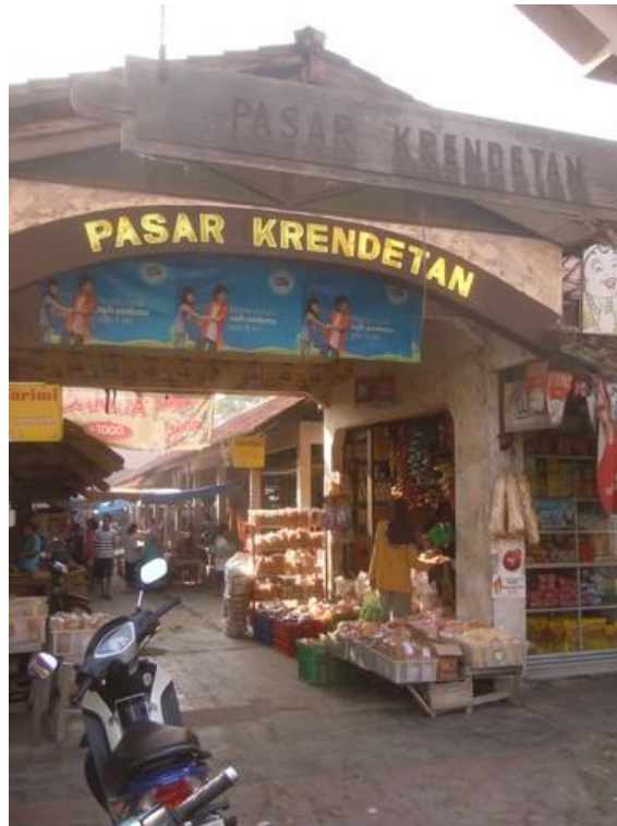
Gambar 2.3 Kondisi Bangunan Pasar Krendetan Sebelum Revitalisasi

pakaian, kebutuhan sehari-hari, kambing dan bibit tanaman. Pasar Krendetan merupakan pasar yang berbatasan dengan Kabupaten Kulonprogo DIY dan terletak di jalur utama Purworejo dan Yogyakarta sehingga pasar sangat ramai.