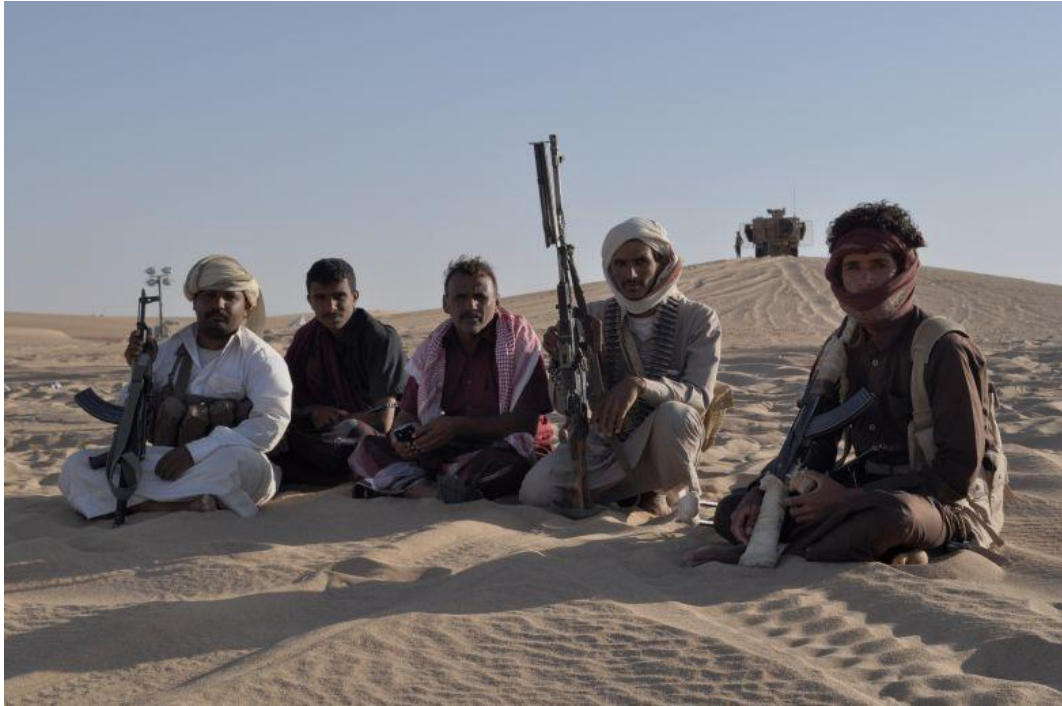
Pasukan Pemerintahan Pro Presiden Yaman berkoalisi dengan Militer Arab Saudi.