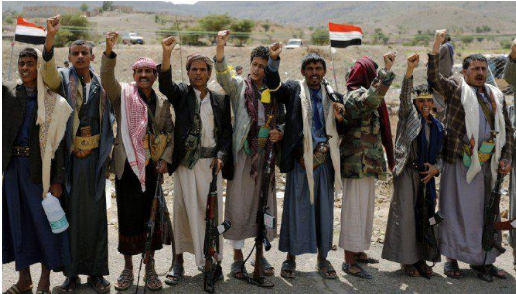
Pemberontak Al-Houthi merayakan kemenangan pertempuran melawan militer Arab Saudi di pinggiran padang dekat Ibukota Sana'a