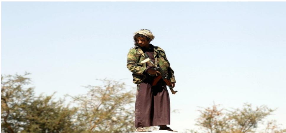
Pasukan remaja Al-Houthi melalui rekrutian warga sipil Yaman