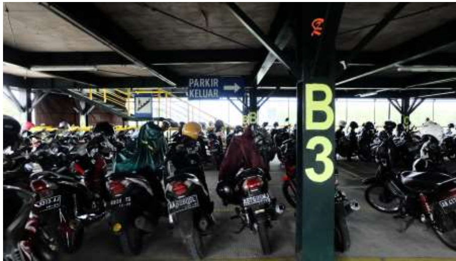
FOTO KENDARAAN YANG PARKIR DI TPM I YOGYAKARTA