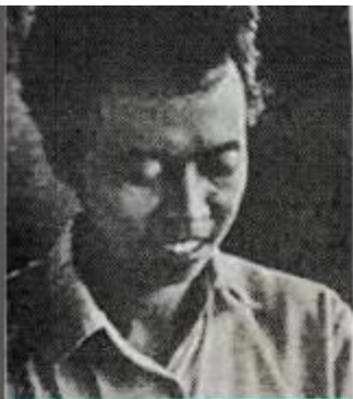
EDITOR: AHMAD SUAEDY RAJA JULI ANTONI