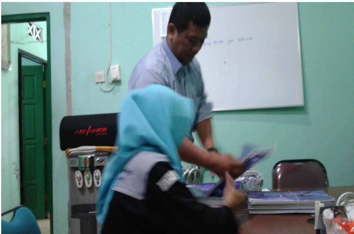
BMT Batik Mataram