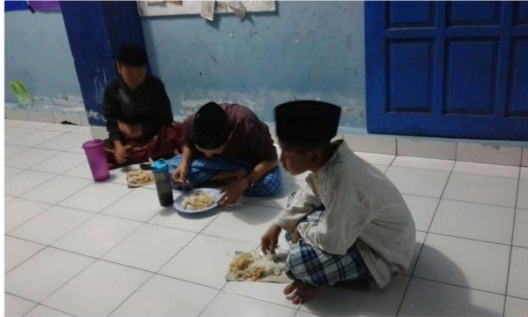
Suasana sahur puasa Senin Kamis