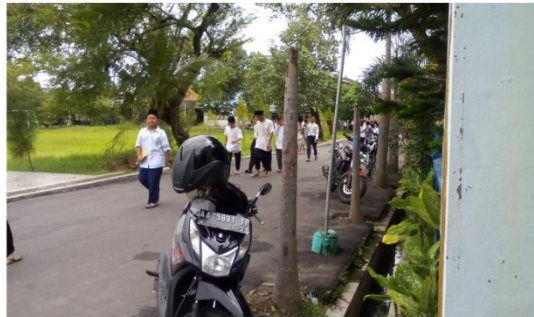
Santri selesai shalat dzuhur berjamaah