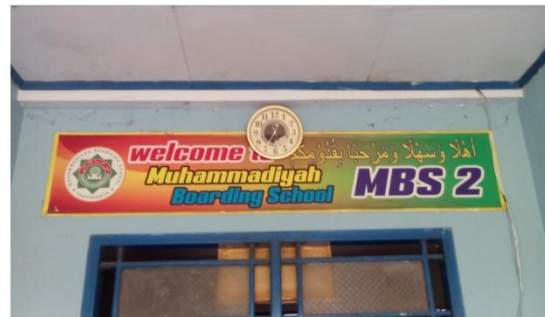
Salah satu kalimat penyambut di MBS 2