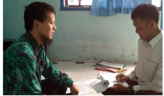
Wawancara dengan beberapa informan