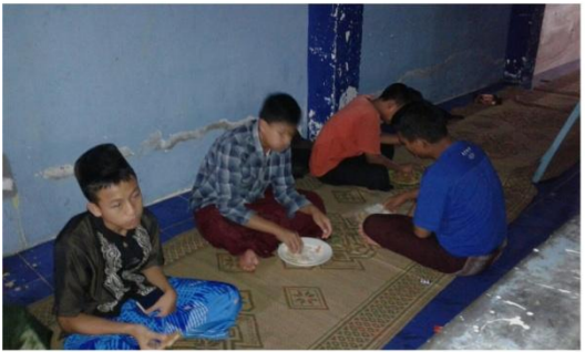
Suasana sahur puasa Senin Kamis