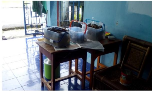
Salah satu menu makanan kiriman dari MBS pusat