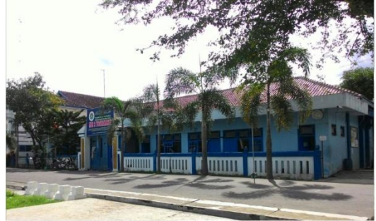
Gedung Kepala Sekolah, TU, dan Kamar pembina kema'hadan MBS 2