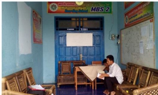
Kegiatan santri ketika belajar santai