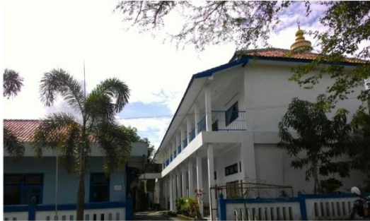
Gedung Baru sebagai tambahan ruang kelas MBS 2