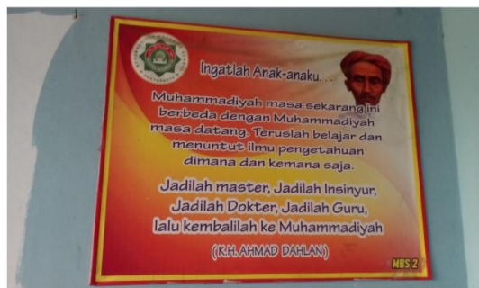
Nasihat-nasihat yang terpasang di dinding Pondok