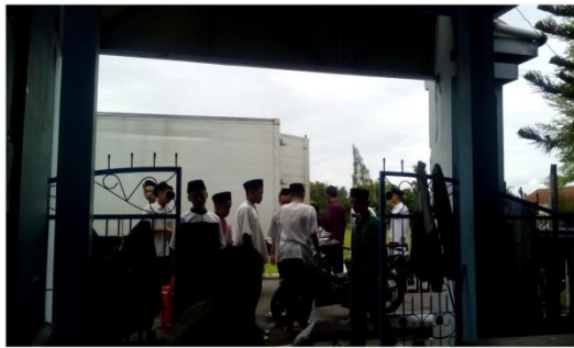
Mobil pengirim makanan dari MBS Pusat