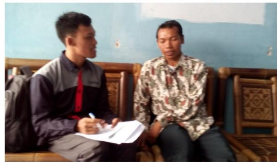
Wawancara dengan beberapa informan