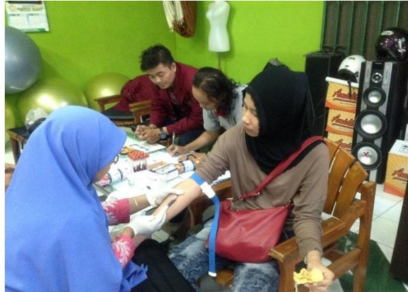
Pengambilan darah responden