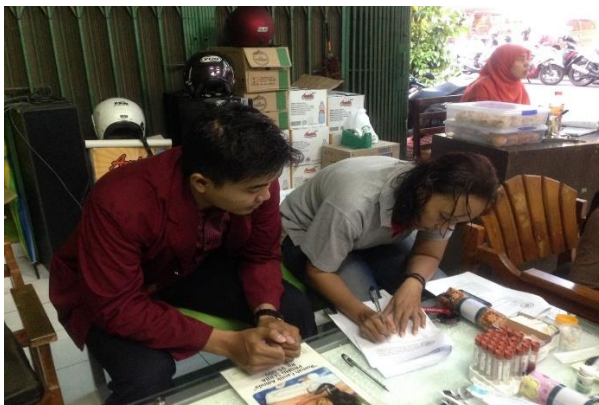
Pengisian informed consent