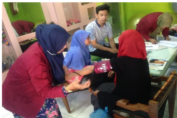
Pengecekan vital sign