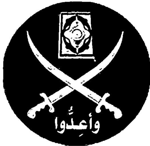
Gambar 3 Lambang Ikhwanul Muslimin