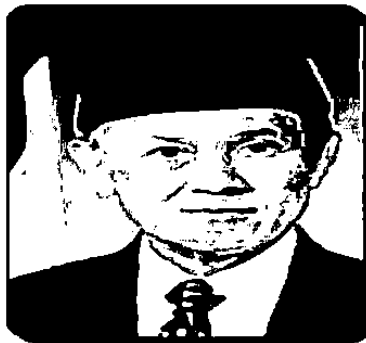
Gambar 2.2 foto Habibie

Sejak bersekolah di SMAK Digo Bandung, B. J. Habibie tampak terlihat berbeda dari teman-temannya. Prestasi Habibie lebih menonjol dari teman-temannya, terutama dalam pelajaran-pelajaran ekstra, seperti matematika, mekanika, fisika, dan lain-lain. Setelah lulus dari SMAK Digo Bandung, Ia melanjutkan studi ke Institut Teknologi Bandung (ITB) sebuah perguruan tinggi negeri yang terletak di Kota Bandung. Selama menjadi mahasiswa di ITB, B. J. Habibie lebih tertarik pada bidang pesawat terbang, akhirnya Habibie hanya 6 bulan menjadi mahasiswa di ITB. Ketertarikannya terhadap bidang pesawat terbang, mendorong Ia untuk melanjutkan studinya keluar negeri. Walaupun saat itu Ia berangkat ke Jerman dengan biaya sendiri, karena pendaftaran bea siswa untuk jurusan Aeronautika sudah ditutup pada tahun itu. Di samping itu ibunya juga pernah berjanji di depan almarhum bapaknya untuk menjadikan anak-anaknya berpendidikan dengan jerih payahnya sendiri.