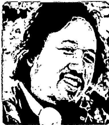
Gambar 2. 5 Faozan Rizal

Faozan Rizal adalah seorang sutradara Indonesia yang begitu mencintai media film. Ia lahir pada tahun 1973 di Tegal, Jawa Tengah.