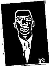
ABDUL RASYID NASUTION