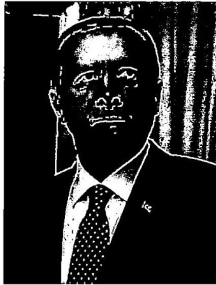
Recep Tayyip Erdoğan