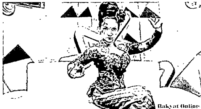
Gambar 2.6 Roro Fitria Neng Geulis Penarik Jaipong dengan Tip-tips untuk lelaki

Neng Geulis yang diperankan Roro Fitria diciptakan untuk memberikan tayangan yang lebih unik dan menarik Neng Geulis di dalam acara Sedap Malam dapat diartikan sebagai gadis sunda, cantik dan pintar yang dirancang khusus ikon Sedap Malam Neng Geulis akan tampil pada segmen ke 4 untuk memberikan tips seputar seluk beluk orang dewasa bagi pemirsanya.