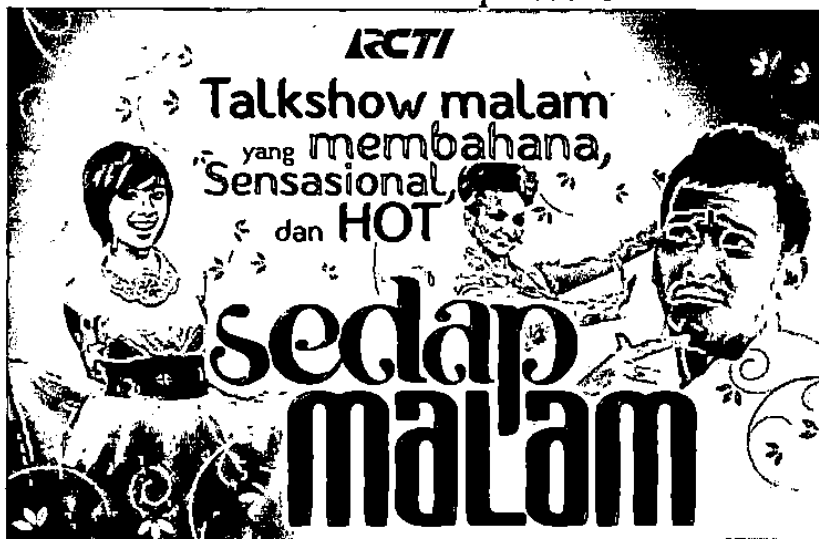
Gambar 2.3 Talkshow Sedap Malam

Acara Televisi seputar dunia laki-laki memang bisa menjadi acara yang cukup populer. RCTI juga tidak ketinggalan memasukkan program acara televisi dengan tema seputar dunia pria yang di kemas dalam sebuah acara Talkshow.