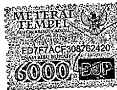
Dwi Awwalul Sa'bani