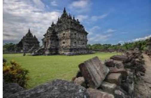
Candi Plaosan yang rusak akibat gempa jogja 2006