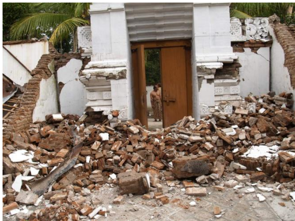
Makam Raja-Raja Jawa di Imogiri, Bantul rusak akibat gempa Jogja 2006