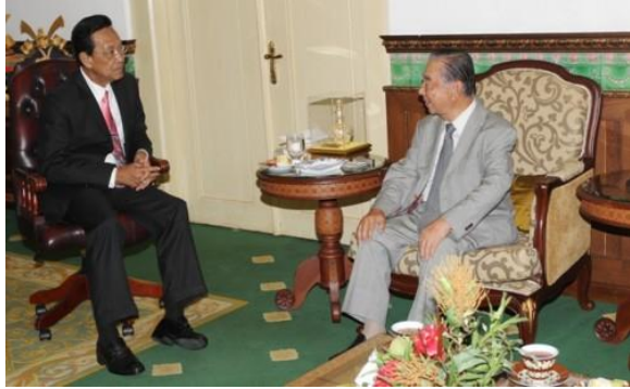
Sultan HB X tengah berbincang-bincang dengan Aramaki Teiichi