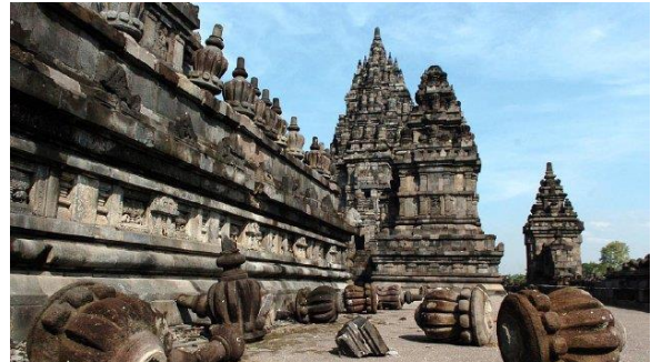
Bangunan Candi di kompleks Candi Prambanan yang rusak akibat gempa