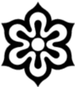
Lambang prefektur Kyoto