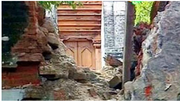
Situs makam Mataram yang rusak akibat gempa Jogja 2006