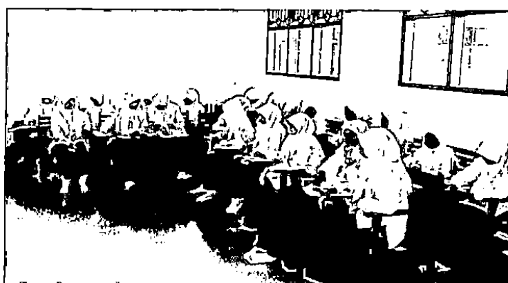
Santri Putri di kelas