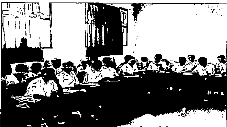
Santri Putra di kelas