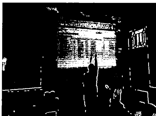
Ust yang mengajar menggunakan LCD