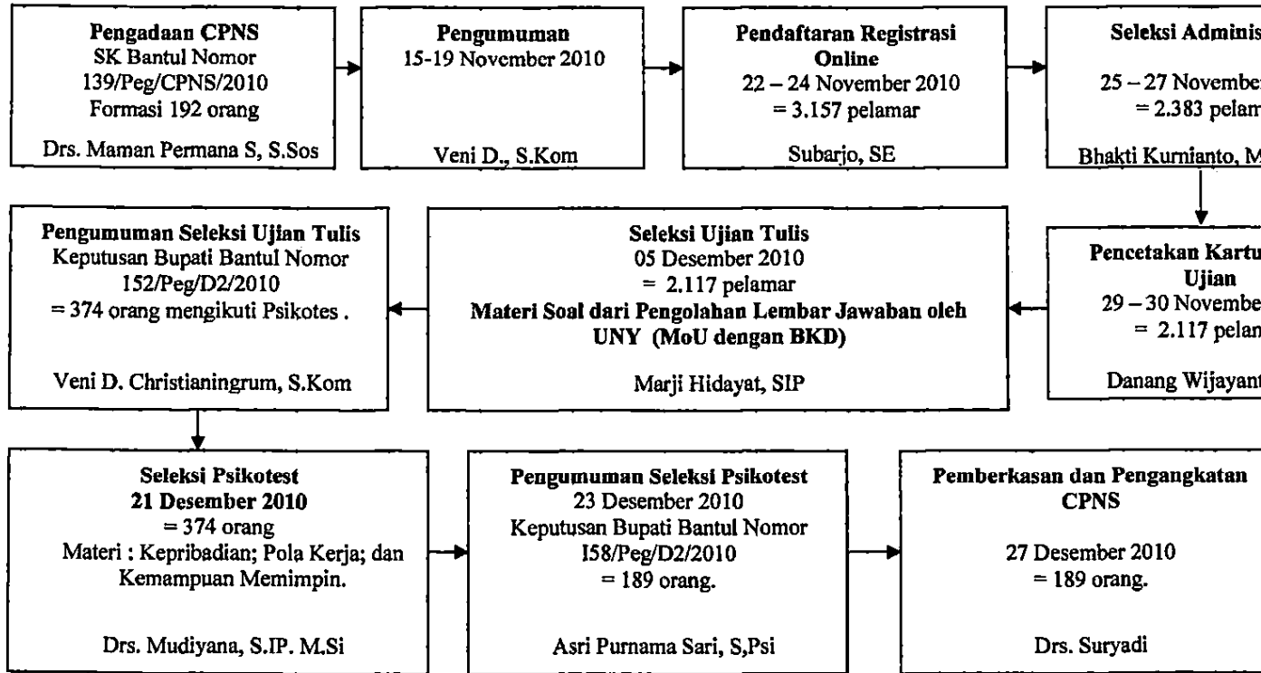
Gambar 3.1. BAGAN ALUR PROSES PENGADAAN CPNS KABUPATEN BANTUL TAHUN 2010