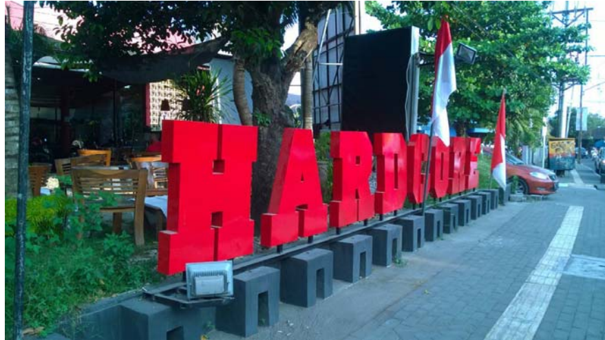
Gambar 2.2 : Lokasi Hardcore Gym Yogyakarta