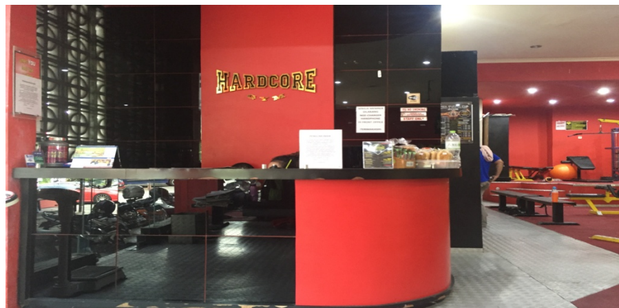
Gambar 2.3 : Front Office Hardcore Gym Yogyakarta