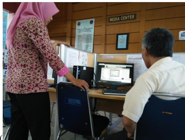
(LPSE Officers Help Provider in Making SPAMKODOK)