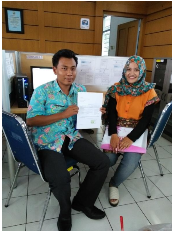
(Taking Picture with LPSE officer)