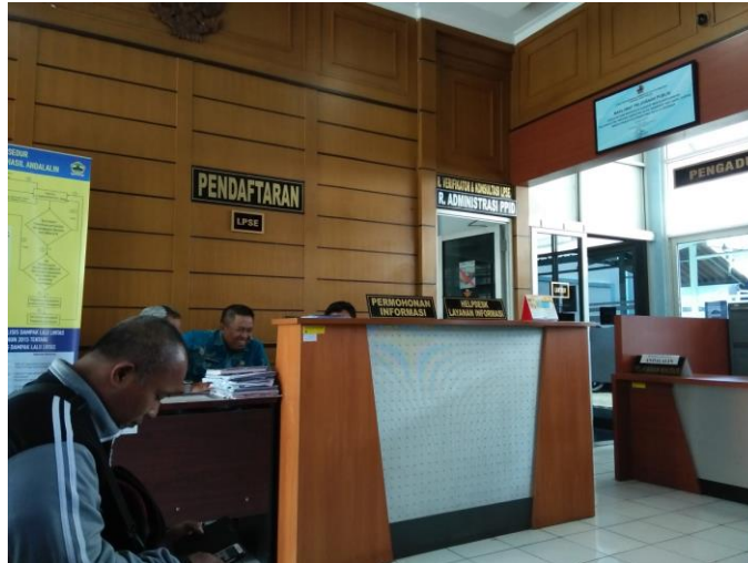
(LPSE room for Provider Registration)