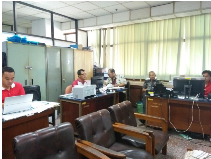
Situation of Bangda Office in Central Java