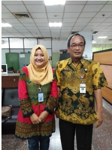
(Interview with the chief of Infrastructure sub-division)