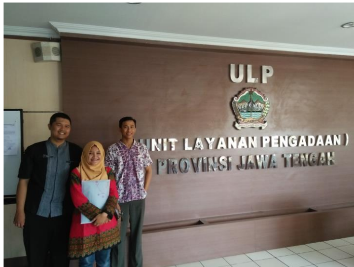
(Taking Picture after having interview with ULP officer)