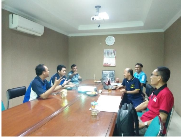
(ULP Officers in Meeting Room)