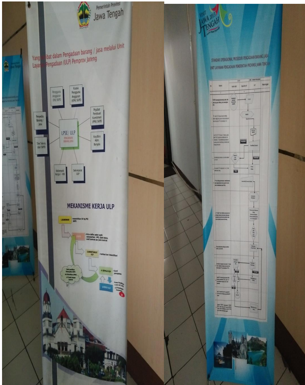
(Way of Joining Procurement)